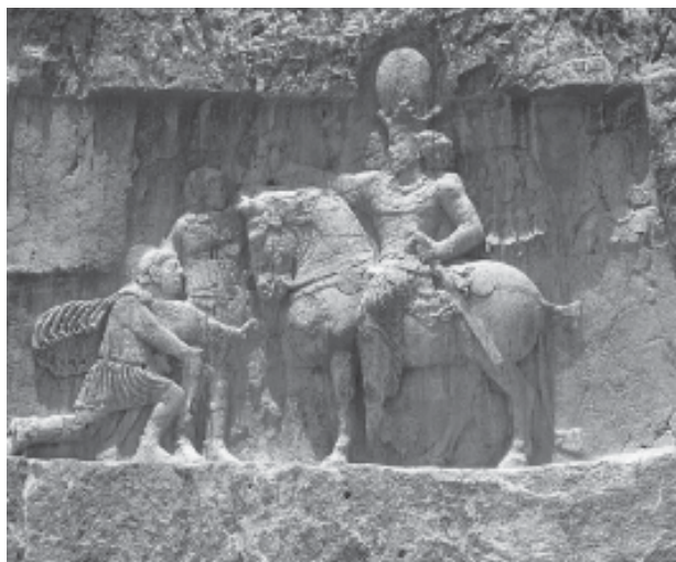
2. Kartir, KNRm