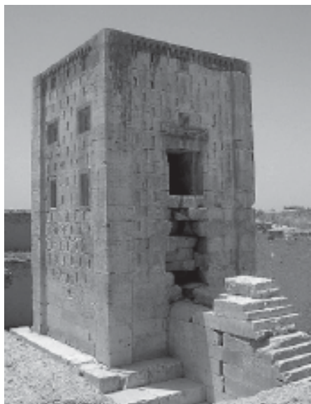
3. Ka'ba-je Zardoszt w Naksze Rostam (zbiory własne)