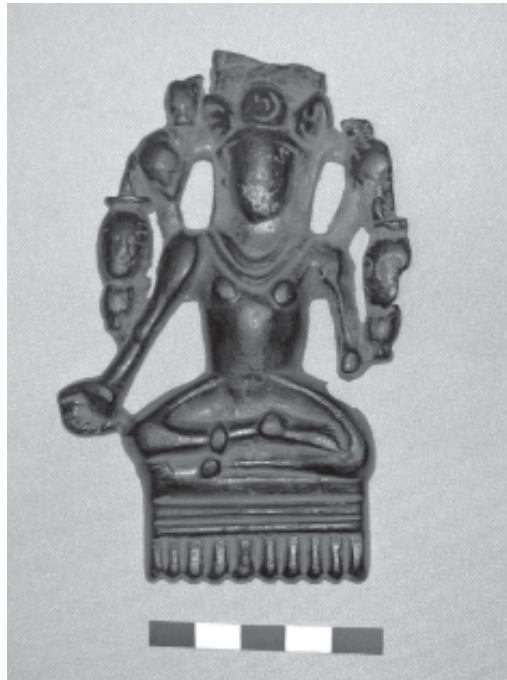
1. Статуэтка Индры (X) век, с поселение Головкино I в районе Старой Майны Ульяновской области.

Считается, что религиозное направление лингаит появляется в Индии не ранее 9 в.н.э., но Клаус Клостермайер, основываясь на данных раскопок в деревне Гудималам, в штате Андхра-Прадеш, проводимых в первой половине 70-х годов прошлого века, высказывает мнение, что почитание