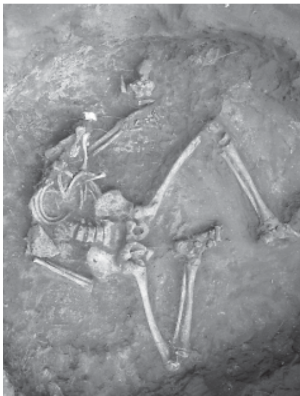
Фото 7 Поховання з могильника Зливки. Подонців'я.

ранньосередньовічному поселенні Хельго, розташованому на захід від Стокгольму, на одному з невеликих островів озера Мелорен (Швеція), відома протягом тривалого часу 18 . На думку Д. Аренса, вона походить зі Східного Туркестану. Виготовлена у V ст. н.е. і Великим Шовковим шляхом була привезена до Сирії, а пізніше, у VII ст., на човнах вікінгів чи арабів, у Швецію. Будду з Хельго пов'язують також з «кашмірськими бронзами» масового виробництва VII ст. 19 . До цього, мабуть, потрібно додати інші видані матеріали. Так, Спіцин у «Новинах Імператорської Археологічної комісії» надрукував кілька знахідок буддійського мистецтва зі степу центральної Росії 20 . Не менш цікава знахідка «стародавньої буддійської статуетки» – «факіра» з с. Стежек Козловського району Тамбовської губернії у 1900 р. (Новости, 16) (рис. 2). Знахідки зображень Будди в насипах курганів ще раз доводять необхідність обговорення питань будівництва та розбору архітектурних композицій у насипу курганних споруд. Особливо коли в його центральній площі вписано рів, квадрат, а