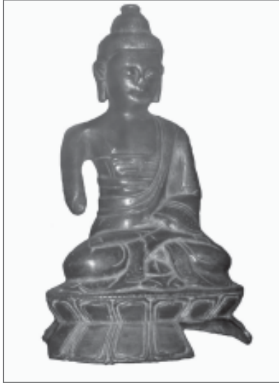
Рис. 5 «М 684. Статуэтка Будди, знайдена на ст. Росава Курська».

через траси Великого Шовкового шляху, через Парфію та Сасанідський Іран. Трансконтинентальна торгівля, що зв'язувала Схід і Захід, здійснювалась за різними маршрутами: водним – по річкам Середньої Азії, Каспій, Кавказ, Чорне море – відомий ще за часів Плінія та Страбона. Пізніше, по Степовій дорозі, що веде через Казахстан, уздовж східного узбережжя Каспійського моря та досягає низовій Волги 12 , йде до берегів Чорного моря (рис. 1, мапа). Другий шлях проходив понад південним берегом Каспію, через Кавказ, вздовж Кури, на північ, де зафіксовані дані про проходження торговельних караванів і знайдені предмети буддійського шанування. Одну з найбільш цікавих знахідок представляють собою «речі китайського купця» історико-культурної пам'ятки VII–IX ст. «Мощева Балка». До комплексу знахідок входить 13 : документ (розписка?); частина буддійської ікони «Чиста земля Будди Амітабхи»; частина документа релігійного змісту (можливо, Сутра); фрагмент обкладинки для рукопису та частина буддійського плетіння (ткацтва?). Хронологічно комплекс знахідок датується VIII ст. і опізнаний як китайський 14 . Домінування знахідок релігійного характеру дає можливість припускати, що їх власник був не китайський купець, а ченець, який виконував деякі бізнес-замовлення (див. «сповіщення»), що мав «нести слово» і поширювати вчення.