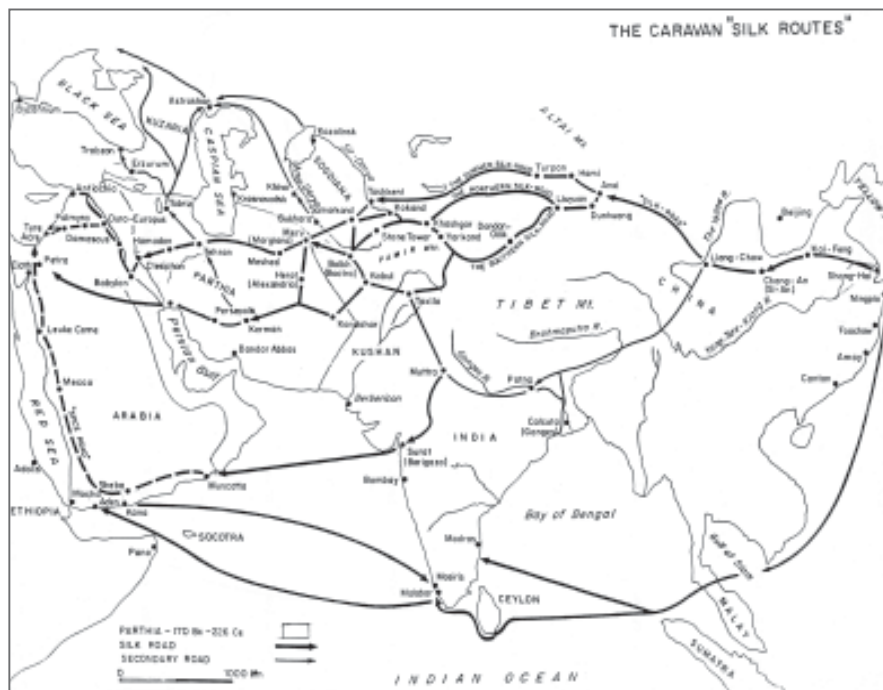
Рис. 1. Мапа торговельних трас Великого Шовкового шляху.

Як велика всесвітня релігія, буддизм народився в Індії у IV ст. до н.е., пізніше, через століття, почав поширюватись на схід та північ. Вже під час