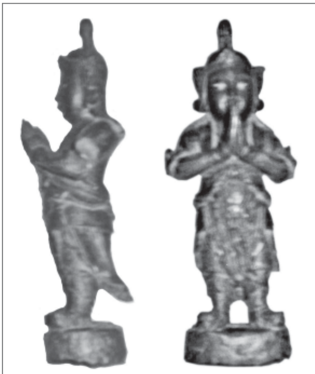
Рис. 6. Фото статуетки Будди (?) в одязі XIV ст. Матеріали з Приазов'я, Донецька область

каравани, і особливо сріблений посуд з буддійською символікою 15 та певними релігійними сюжетами та композиціями. Більшість з цих композицій – геометричні фігури: 3-, 4- або 5-кутники з вписаним колом, 8-кутники, 12-кутники, порожні кола. Це було характерним для доби раннього Середньовіччя Хазарського каганату. Можливо і раніше у степу з'являється художній стиль зі східними традиціями. Це образ лотосу, Гори і змішані поєднання геометричних фігур для ювелірних виробів (рис. 3). Цікава присутність цих сюжетів на поясній пряжці з поховання хазарського часу в Подонні, а також зображення «метелика совки», характерного символу буддизму. С. Дончев, розглядаючи поширення культури прото-болгар у степах Східної Європи, на прикладі аналізу структури графічних символів-зображень: лотоса, «прадіда та мандали», знаходить схожість у буддійському символізмі 16 (рис. 4). До зображень з буддійською символікою ми можемо додати набір вузди з поховання, знайденого у Донбасі 17 . Одну з найбільш цікавих знахідок зображень Будди, пов'язану з торговельними шляхами до Європи, можна вважати унікальною. Знайдена на