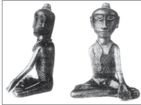
Рис. 2. Статуэтка з с. Стежки, Козловського уезду Тамбовської губ. А Спіцин.

Слід зазначити, що значною мірою успіху буддизму сприяли гнучкість і адаптивність вчення до місцевих умов. Буддизм ніколи не стверджував, що має виняткову роль у свідомості корінного населення, але й прихильники вчення Будди не відчували тиску завойовників, наприклад ефталітів, а потім тюрк. Під час війни деякі буддизмські культові будівлі було зруйновано і пограбовано. Однак новому етапу зростання буддизму у VII столітті сприяли тюркські правителі, які піддалися впливу цього вчення ще до