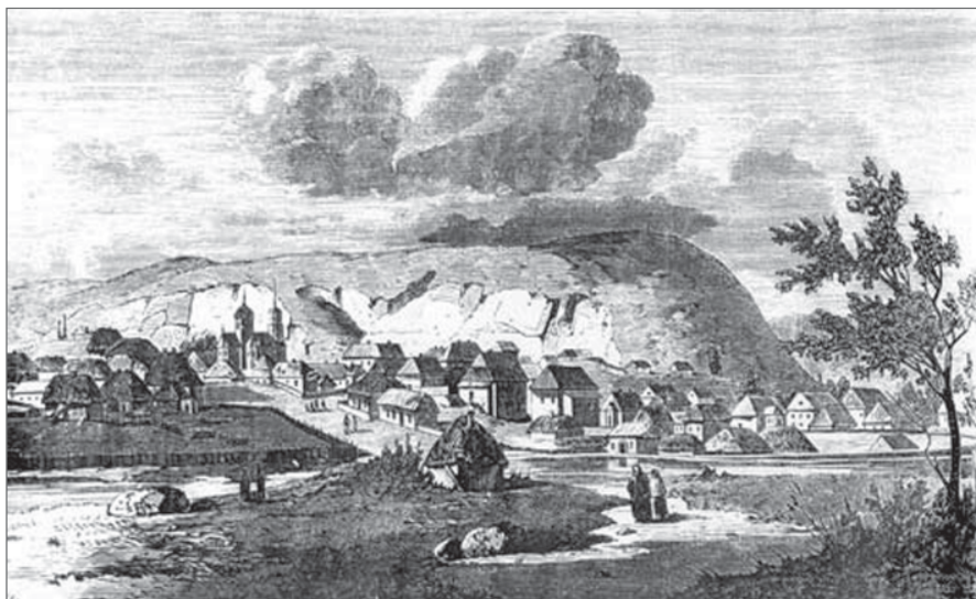
К. Пржичиховський. Чигирин. 1861 р.