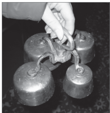
Рис. 8. чотиридзвін

обшиті пластиком. Вільному поширенню звуку дзвонів сприяє те, що голосники заввишки 147 см, завширшки – 125 см (вони своєрідно розділені, мабуть, для зміцнення, раменами хреста). Дзвонять із першого ярусу за шнур, який пропущено крізь поміст.