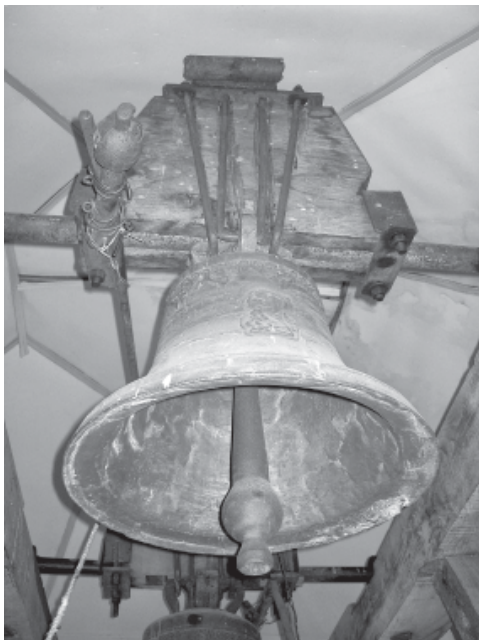
Рис. 2. Дзвін УАПЦ

Перший дзвін замовили 2001 року в Миколаєві (Львівська обл.) заввишки з короною близько 76 см, діаметр – 77 см, вагою близько 250 кг (рис. 2). Язик має велику шишку. Після вдаряння у дзвін, який виготовлений зі сталі, він довго «тягне» звук, що свідчить про добре відливання інструмента та його пропорції. На валу дзвона укріплено потовщення заввишки 4 см. Перед валом – укріплюючи тяга заввишки 4,5 см. Плащ оздоблено рельєфом Ісуса Христа (?) заввишки 18 см. Фриз дзвона оздоблено орнаментом (7 см), що ритмічно повторюється. Язик підчеплено на металевій петлі, внизу він без отвору для прив'язування шнура. Зверху окуття для кращого розгойдування дзвона прикріплено противагу – великий шматок металу.