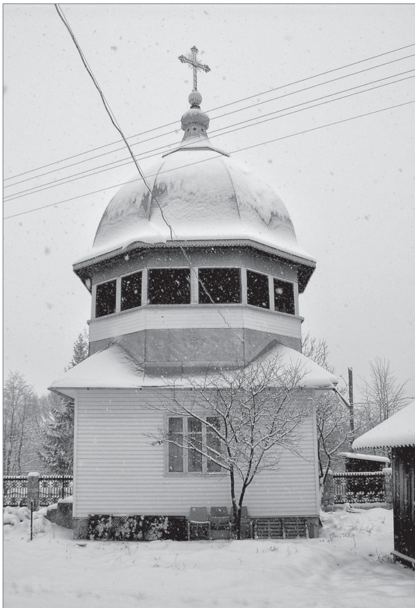
Рис. 1. Дерев'яна двоярусна дзвіниця-каплиця УАПЦ, збудована 2001 року