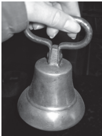
Рис. 7. Вівтарний дзвінок