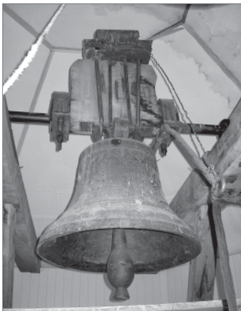
Рис. 5. Новіший дзвін УАПЦ

До побудови дзвіниці дзвін був підвішений на двох металевих стовпах із дашком (вони й нині збереглися). На першому ярусі дзвіниці-каплиці (див. Іл. 5) зберігаються різні церковні речі. Другий ярус восьмигранний із чотирма голосниками, інші сторони