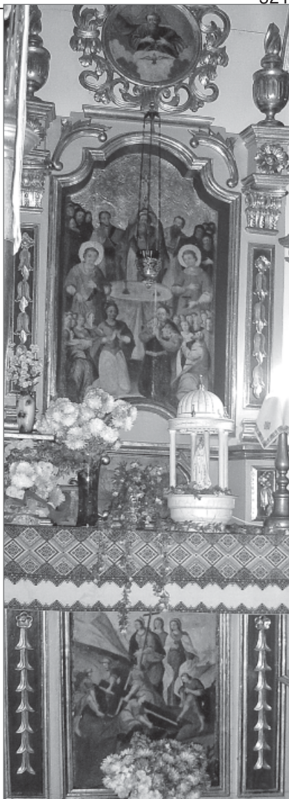
Рис. 1. Бічний вітварь Воздвиження Чесного Хреста Господнього, церкви св. великомучениці Параскеви, с. Погорільці, Золочівський р-н

В українському мистецтві завжди були поширені ікони із зображеннями улюблених святих. Кожне століття витворювало особливі і самобутні стилізовані образи святих, яким приписувалися дивовижні діяння, чудеса чи богословські думки. Зрозуміло, що образи не поставали на порожньому місці. Зазвичай певні особи чи історичні обставини породжували ці апокрифічні перекази. До числа таких образів належать зображення