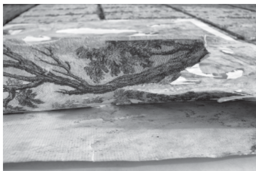
Рис. 6. І. Сошенко «Порт у Кумах. Італія» з колекції Корсунь-Шевченківського державного історико-культурного заповідника. Фото в процесі реставрації

Прикладом науково-методичної допомоги музеям є також обстеження гобеленів XVIII ст. в Київському музеї мистецтв ім. Богдана та Варвари