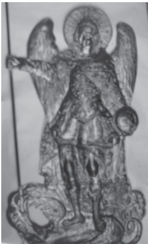
Рис. 2. Герб м. Києва «Архангел Михаїл» з Подільської ратуші