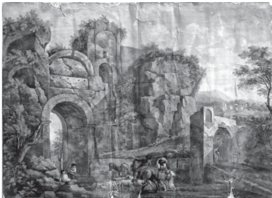
Рис. 5. І. Сошенко «Порт у Кумах. Італія» з колекції Корсунь-Шевченківського державного історико-культурного заповідника. Фото до реставрації

Прикладом науково-методичної допомоги музеям є також обстеження гобеленів XVIII ст. в Київському музеї мистецтв ім. Богдана та Варвари