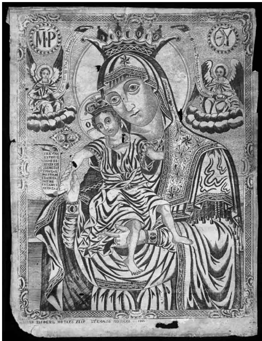
Лл. 1. Гравюра Образу Пресвятої Богородиці «Достойно Є» із зібрання Ізмаїльського історико-краєзнавчого музею Придунав'я. Лицьова сторона твору до реставрації