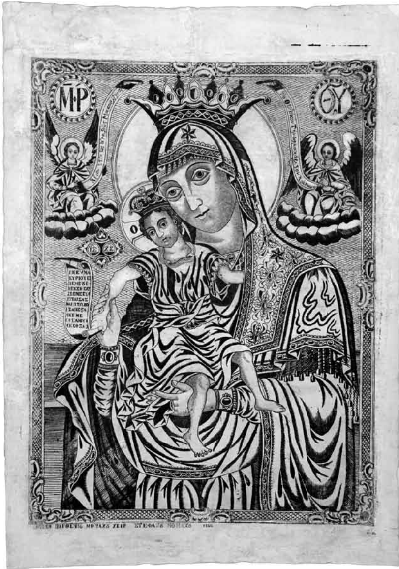
Пл. 4. Гравюра Образу Пресвятої Богородиці «Достойно Є» із зібрання Ізмаїльського історико-краєзнавчого музею Придніав'я. Лицьова сторона твору після реставрації