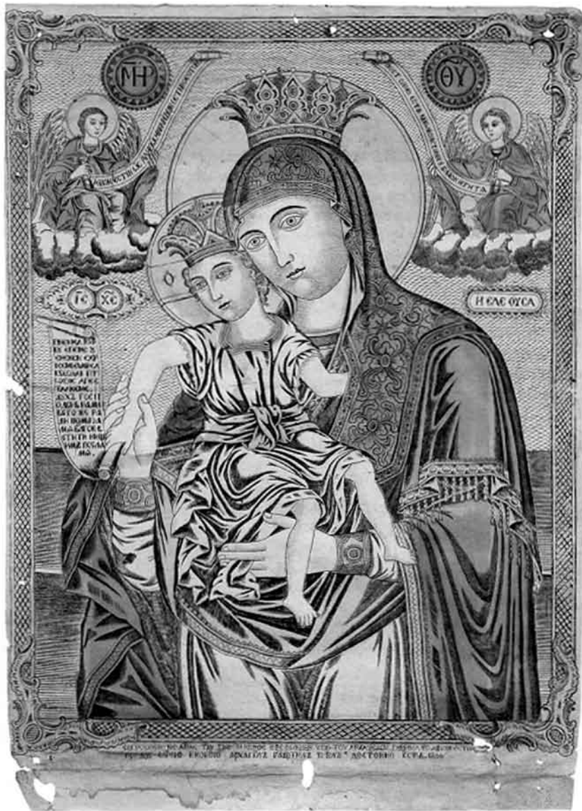
Іл. 5. Кольорова гравюра Образу Пресвятої Богородиці «Достойно Є» із зібрання монастиря Симонопетра на Афоні. 1866 р.