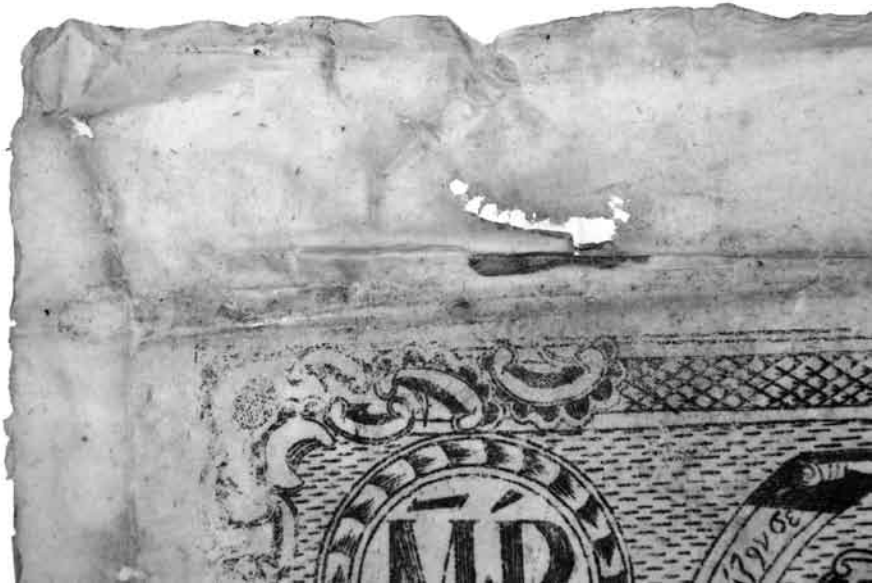
Іл. 3. Фрагмент гравюри з розгорнутими краями. Лицьова сторона твору в процесі реставрації

Під час реставрації твору найбільшою складністю вирізнялися процеси, пов'язані з розгортанням країв та видаленням численних, різноманітних за розміром, кольором та походженням плям. Оскільки папір основи був вкрай пересушений, для запобігання ризику його пошкодження під час розгортання країв, твір спочатку було пластифіковано за допомогою розчину гліцерину (5 крапель на 1 л води). Далі, безпосередньо під час проведення процесу розгортання, виявилось, що краї мають набагато більше втрат та розривів, ніж було зазначено реставратором під час опису (іл. 3). З одного боку, це збільшило обсяг роботи, з іншого, внаслідок проведеного процесу, було нарешті встановлено справжній розмір аркуша, який становив 45,5-46×32-33,2 см.