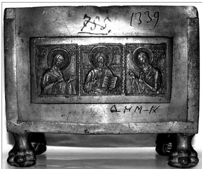
Іл. 2. Дарохранильниця Кирила Тарловського. Нижній ярус. Росія, 1750–1762 рр. Олово, лиття. ДНІМ, інв. № К-1339.