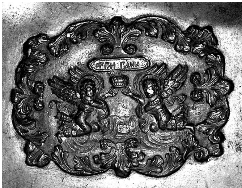
Іл. 6. Ангели Господні. Зворотна сторона нижнього ярусу.