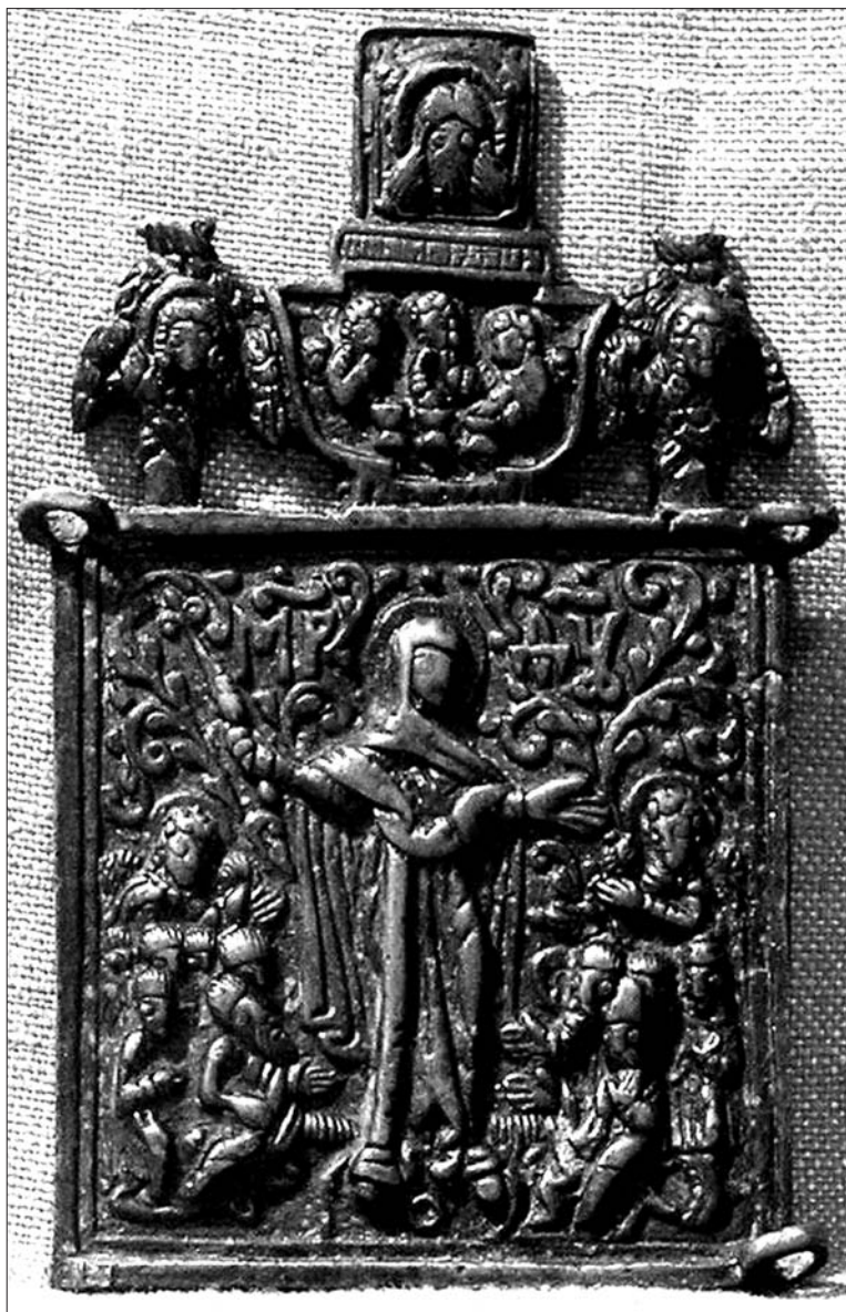
Іл. 8. Образ Богородиці Всіх Скорботних Радість. Центральна стулка складня. Росія, XIX ст. Мідь, лиття. ДНІМ, інв. № К-1837.