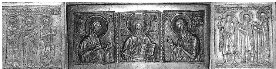
Іл. 7. Складень «Дев'ятка».