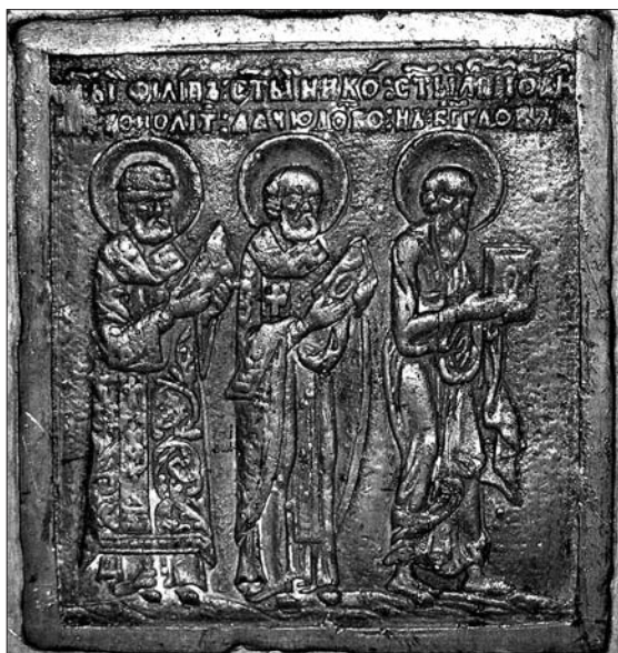
Іл. 5. Святі митрополит Філіп, Микола Чудотворець, Іоани Богослов. Ліва сторона нижнього ярусу.