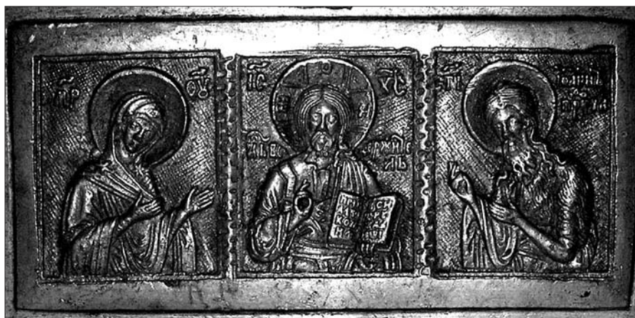
Іл. 3. Деїсус. Передня сторона нижнього ярусу.