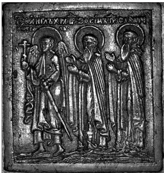
Іл. 4. Ангел-хоронитель, Преподобні Зосима і Савватій. Права сторона нижнього ярусу.