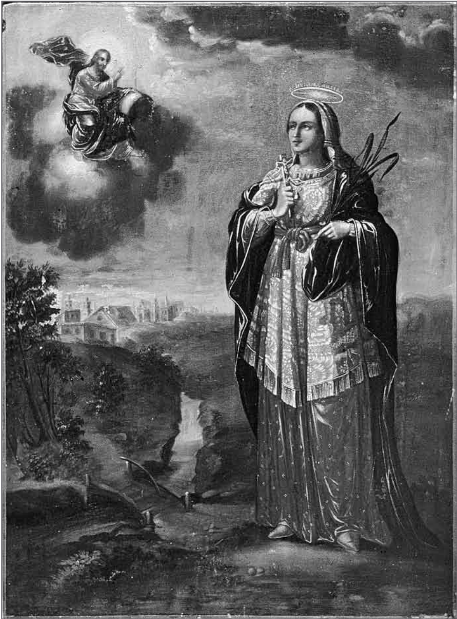
Іл. 3. Св. пакутніца Людміла. Брэст. XIX ст. Дошка, алей, 71×53