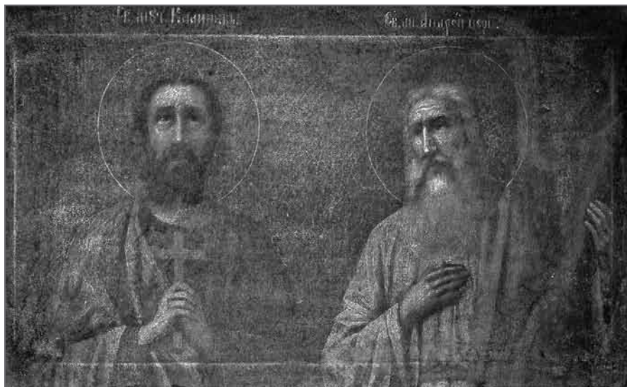
Іл. 2. Св. пакутнік Каллінік. Бярозаўскі раён Брэсцкай вобл. Другая палова XIX ст. Палатно, алей, 36×60

На адзіным абразе з Брэсцкай вобл. св. Каллінік прадстаўлены ў паясной выяве разам з апосталам Андрэем Першазваным (іл. 2). Святы пакутнік абодвума рукамі прыціскае да грудзей крыж, яго позірк скіраваны ўверх.