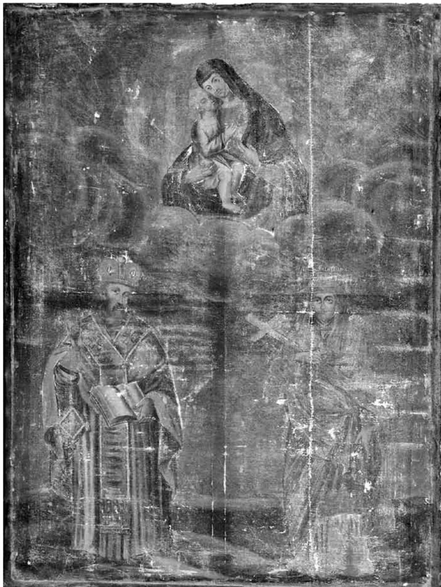
Іл. 6. Св. Макрына і свяціцель Васіль Вялікі. Камянецкі раён Брэсцкай вобл. VIII ст. Палатно, алей, 146×100