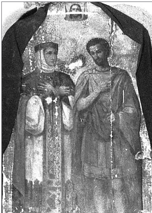
Іл. 1. Св. вялікапакутнікі Ірына і Феадор Страцілат. Добруш Гомельскай вобл. Другая палова XIX ст. Дошка, алей, 130×80

Святы пакутнік Каллінік (III-IV ст.), згодна жыцця, паходзіў з Кілікіі (М. Азія) і з дзяцінства быў выхаваны ў хрысціянскай веры. За прапа-ведванне вучэння Іісуса Хрыста прыняў жорсткія пакуты і быў спалены на вогнішчы. Яго памяць шануецца 11 жніўня (29 ліпеня).