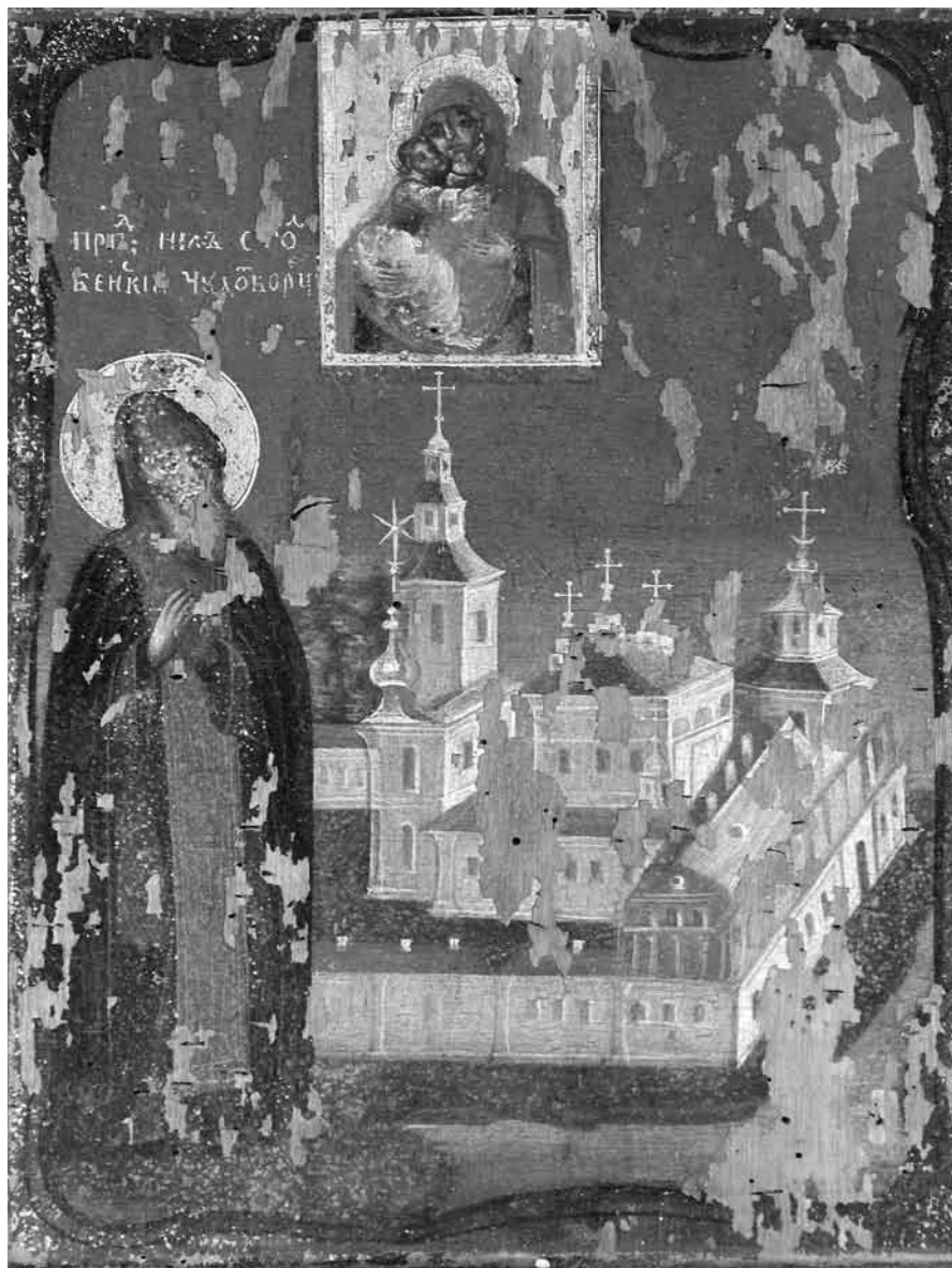
Іл. 9. Прѣнадобны Нїл Сталобенскї. Івацѣвїцкі раѣн Брѣсцкай вобл. ХІХ ст. Дошка, алеї, 31×24