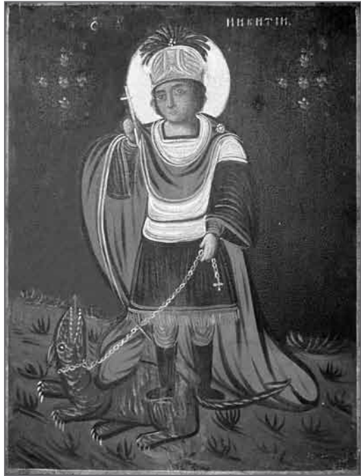
Іл. 8. Св. пакутнік Нікіта Бесагон. Глыбоцкі раён Віцебскай вобл. Пач. XIX ст. Дошка, алей, 40×29

На двух абразках, выкананых ў інсітным стылі, што зафіксаваны ва ўсходніх рэгіёнах Беларусі, замест сцэны пабівання прадстаўлена даволі статычная кампазіцыя, дзе св. Нікіта ў воінскіх даспехах і доўгім чырвоным плашчы трымае павержанага д'ябла на ланцугу. На абразе з Віцебскай вобл. (іл. 8) ён левай нагой прыціскае д'ябла да зямлі, а