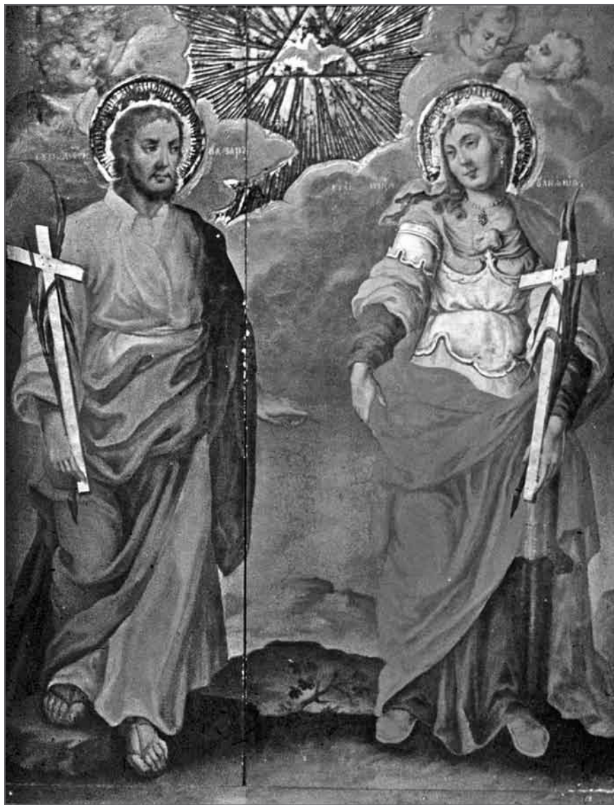
Лл. 7. Св. пакутнікі Назарый і Іуліанія Нікамідзійская. Магілёў. 1823 г. Дошка, тэмпера, 95×75