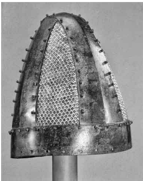
Il. 1. Hełm późnosasanidzki typu crossbandhelme o prostych żebrach (The Metropolitan Museum of Art, Nowy Jork, Access Nr. 62.82)

puszczać, że hełmy typu cross-bandhelme reprezentowane chociażby przez hełmy z Musées Royaux d'Art et d'Histoire w Brukseli (inv. Nr. Ir.13.15) czy hełm z The Metropolitan Museum of Art w Nowym Yorku (Inv. Nr. 62.82) ( il. 1 ), o prostych końcach żeber reprezentują, podobnie jak ma to miejsce z europejskimi hełmami typu spangenhelme, późniejszą ewolucję w obrębie jednego typu. Skutkowałoby to uznaniem typu Amlash jako wersji pierwotnej wśród irańskich konstrukcji. Teza ta nie pozwala jednak na chronologizację samych zabytków, ponieważ nie sposób wykluczyć, że hełmy o łukowatych podstawach żeber, jako odrębna forma wewnątrz jednej grupy, używane były równolegle do nowo powstających ewolucji.