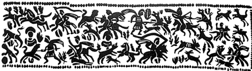
Il. 2. Forma powtarzającego się wzoru, wybijanego na dolnej taśmie hełmu z Chalon-sur-Saône we Francji. W 1002. Rysunek autora, na podstawie: Vogt M. Spangenhelme. Bandenheim und verwandte typen – Mainz, 2006 – beilage 3

Hełm z Chalon-sur-Saône we Francji obecnie znajduje się w Deutsches Historisches Museum w Berlinie, inw. nr. W 1002. Na szczególną uwagę zasługuje najlepiej zachowana dolna taśma dekoracyjna. Ozdobiona została powtarzającym się pięciokrotnie motywem ( il. 2 ). Przy czym sam motyw dekoracyjny nie został dopasowany bezpośrednio do wielkości hełmu. Na tylnym łączeniu dwa fragmenty nachodzą na siebie i sama dekoracja została skrócona. Ukazuje ona po pięć polowań, rozłożonych w dwóch rzędach – górnym i dolnym. Polowania zarówno konne, jak i piesze. Nie można zauważyć żadnego logicznego kierunku czytania przedstawień. Każde z polowań można czytać jako osobną scenę przemocy, w której następuje konfrontacja z bestią.