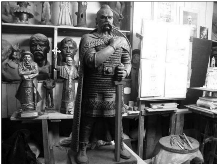
Рис. 11. Проект пам'ятника Святославу в м. Севастополь (скульптор В. Суханов)