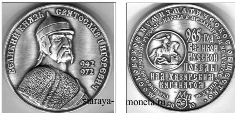
Рис. 5. Пам'ятна монета. 2010. Зліва – аверс; справа – реверс