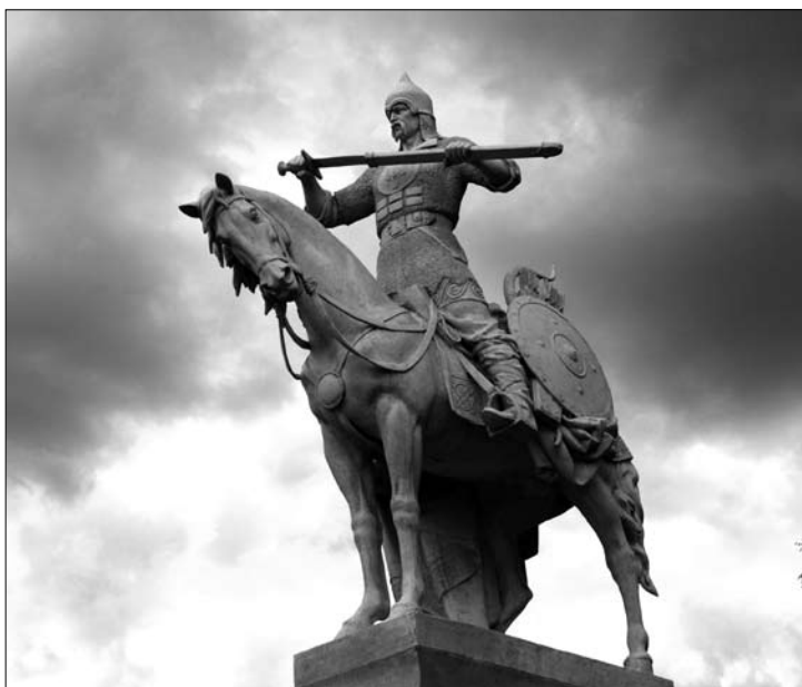
Рис. 8. Пам'ятник в с. Старі Петрівці, Київської області (автори Б.Крилов та О. Сидорук)