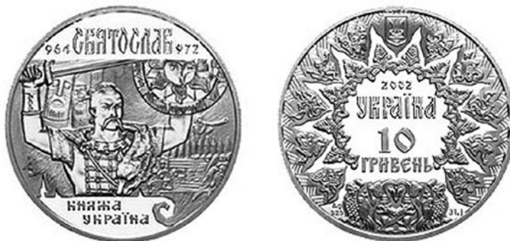
Рис. 4. Пам'ятна монета. 2002