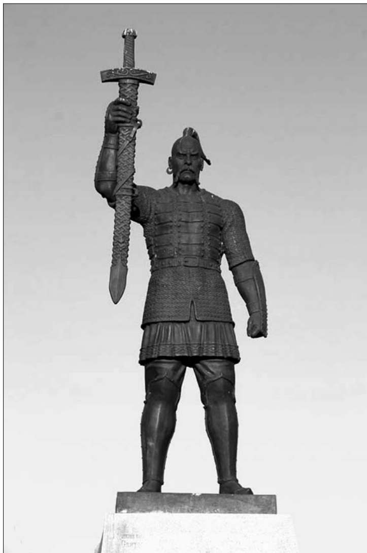
Рис. 9. Пам'ятник Святославу в м. Запоріжжя (скульптор В. Кликов)