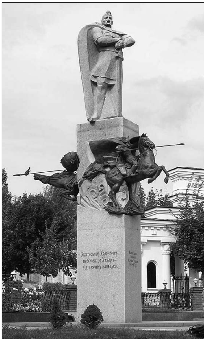
Рис. 6. Пам'ятник на території Міжрегіональної академії управління персоналом (скульптори О. Сидорук та Б. Крилов).