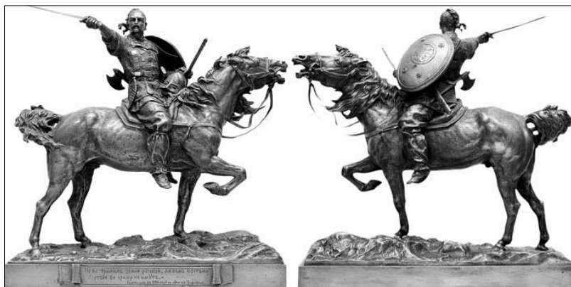
Рис. 2. Святослав Ігорович. Скульптура роботи Е.Лансере. Бронза. Вигляд з обох сторін.