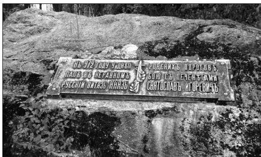
Рис. 3. Пам'ятний знак біля с. Микільське-на-Дніпрі. Б. Едуарде