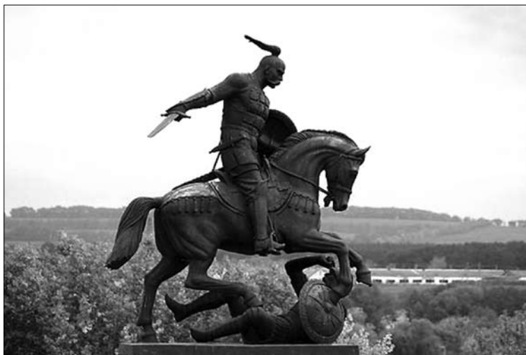
Рис. 10. Пам'ятник князю Святославу в м. Белгород (скульптор В. Кликов)