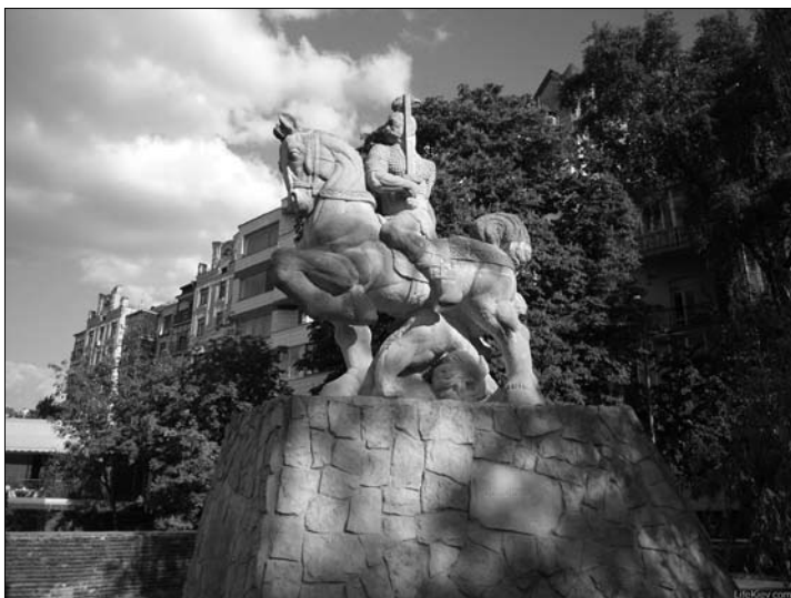
Рис. 7. Пам'ятник на Пейзажній алеї (скульптор О. Пергаменецький)