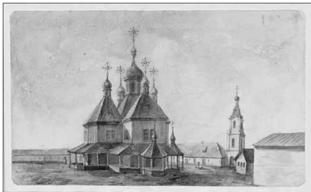
Іл. 2. Тройцкі сабор Маркава манастыра ў Віцебску

Унутры сцены і скляпенні Тройцкага сабора Маркава манастыра цалкам пакрываў роспіс, зроблены ў параўнанні з вышэй разгледжанымі куцеінскім і тупічэўскім не клеевымі, а алейнымі фарбамі на палат-