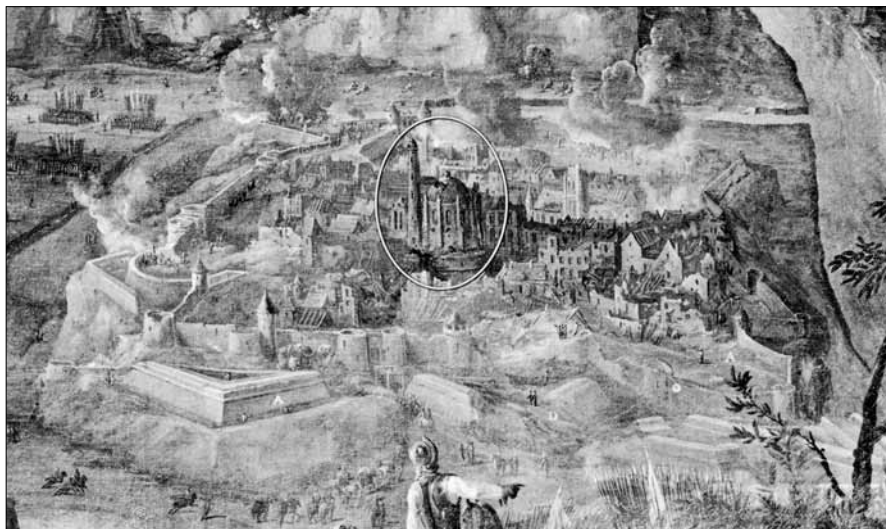
Іл. 2. Мечеть у с. Язловець (фрагмент картини)

ної сторони цієї споруди, яка, на нашу думку, виконувала функції мечеті, прибудований високий п'ятиярусний мінарет круглої форми з арочними вікнами на кожному ярусі. Мінарет увінчував напівсферичний витягнутий купол, під яким знаходився балкон для муедзина. Весь цей комплекс будівель розташований на мурованому підвищенні, що, ймовірно, виконували функції школи (медресе), лікарні, притулку (іл. 2).