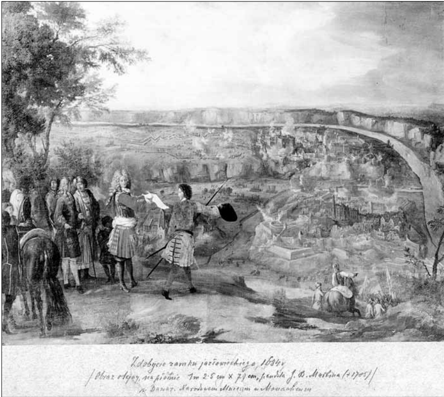
Іл. 1. Картина Мартіна «Здобуття Язловецького замку»

ця присвячено публікації М. Гайди 6 , Р. Підставки 7 , О. Рибчинського 8 , які також не висвітлюють на турецький період міста. У монографії Б. Гверкен лише подає перелік історичних подій 70–80-х років XVII ст. з посиланнями на А. Чоловського: 10 жовтня 1672 р. Язловець був здобутий пашею Аден Гусейном; у 1675 р. містечко було звільнене від турків; наступного 1676 р. через недбальство коменданта місто знову здобув паша Ібрагім Шишман; 1683 р. була невдала спроба краківського каштеляна Аджя Потоцького здобуття Язловець; з вересня 1684 р. розпочинається кампанія під керівництвом Яна III Собеського по визволенню містечка. Стосовно інформації про діяльність турків у Язловці у праці Б. Гверкена немає жодної інформації.