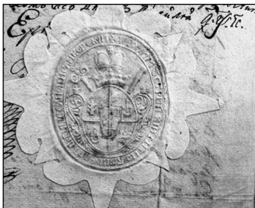
Іл. 1. 1720–1742 pp.