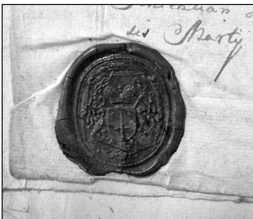
Іл. 5. 1743–1744 pp.