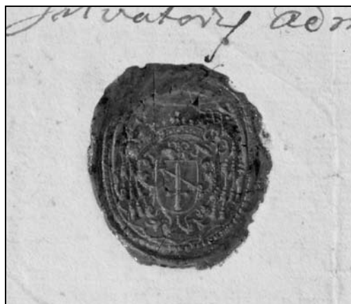
Іл. 6. 1744 p.