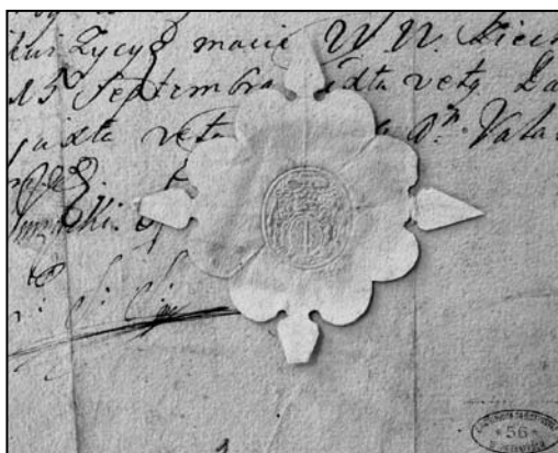
Іл. 3. 1730–1744 pp.