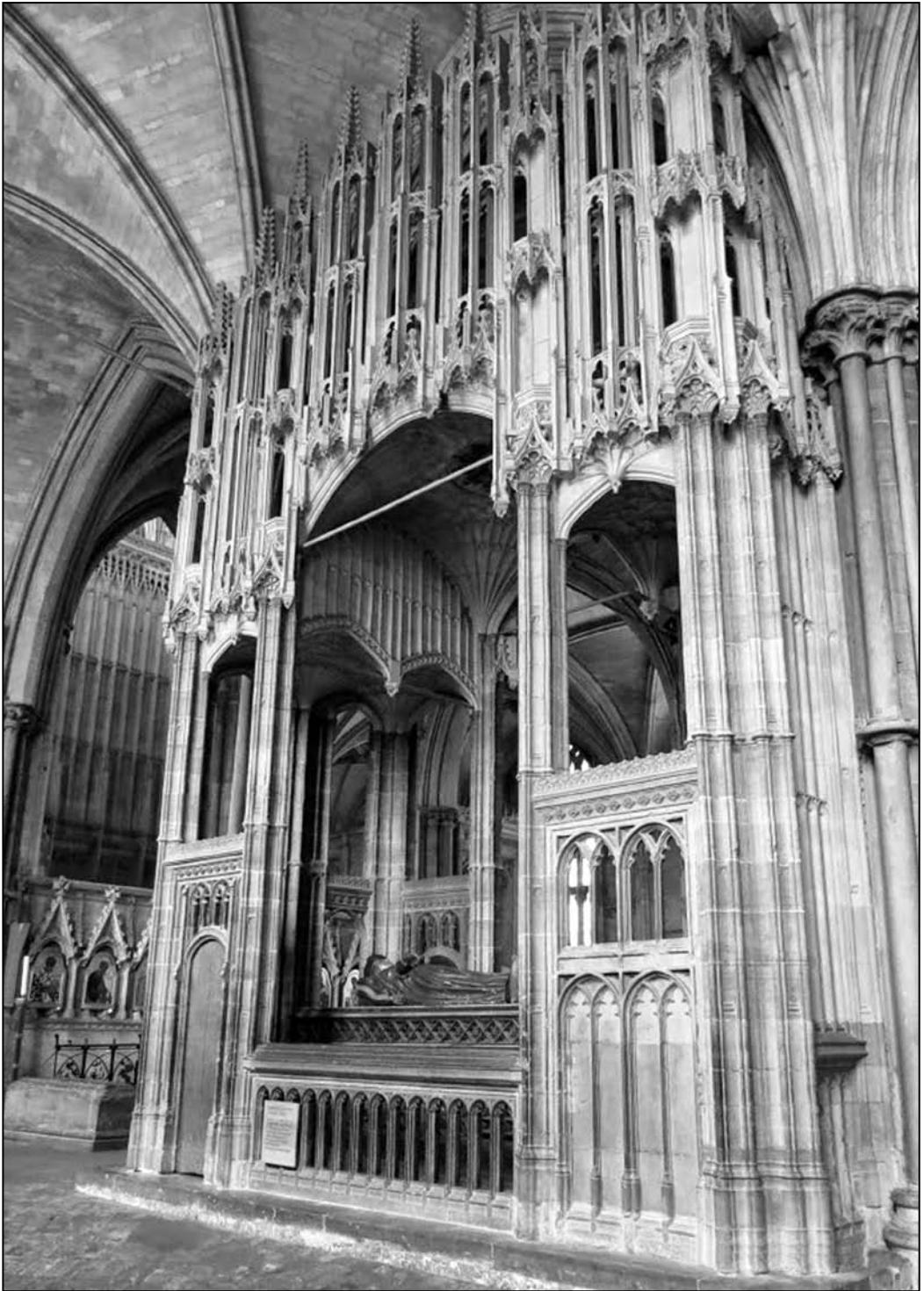
Лл. 4. Орган у Великобританії. Кафедральний собор Вінчестера [34]