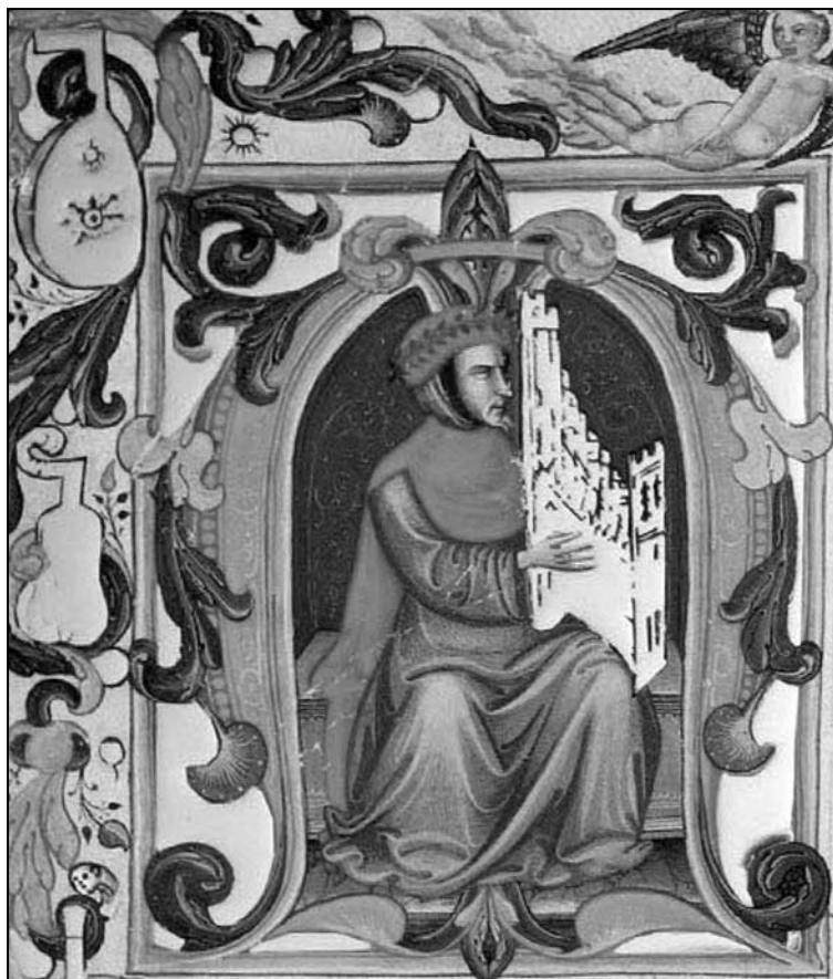
Іл. 6. Зображення Ф. Ляндіні на сторінці кодексу "Squarcialupi" [36]

Не менш відомим є німецький органіст і композитор Арнольд Шлік (~1455–1521), який хоч і був незрячим, уславився як відомий експерт у сфері налаштувань органів. У 1511 р. А. Шлік опублував перший у Німеччині трактат з органобудування і техніки гри на цьому інструменті "Spiegel der Orgelmacher und Organisten" [11].