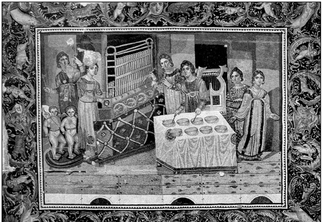
Іл. 2. Гра жінки (зліва) на портативному органі (гідравлосі?). Мозаїка з візантійської вілли. Кінець IV ст. н. е. Археологічний музей м. Хама [23]

Інструмент Ктесібіуса продовжував існувати і не втратив свої ритуальності з ослабленням Давньогрецької демократичної державності і зміщення культурно-історичної ваги з Греції до Римської імперії як центру Середземноморської цивілізації (іл. 2).