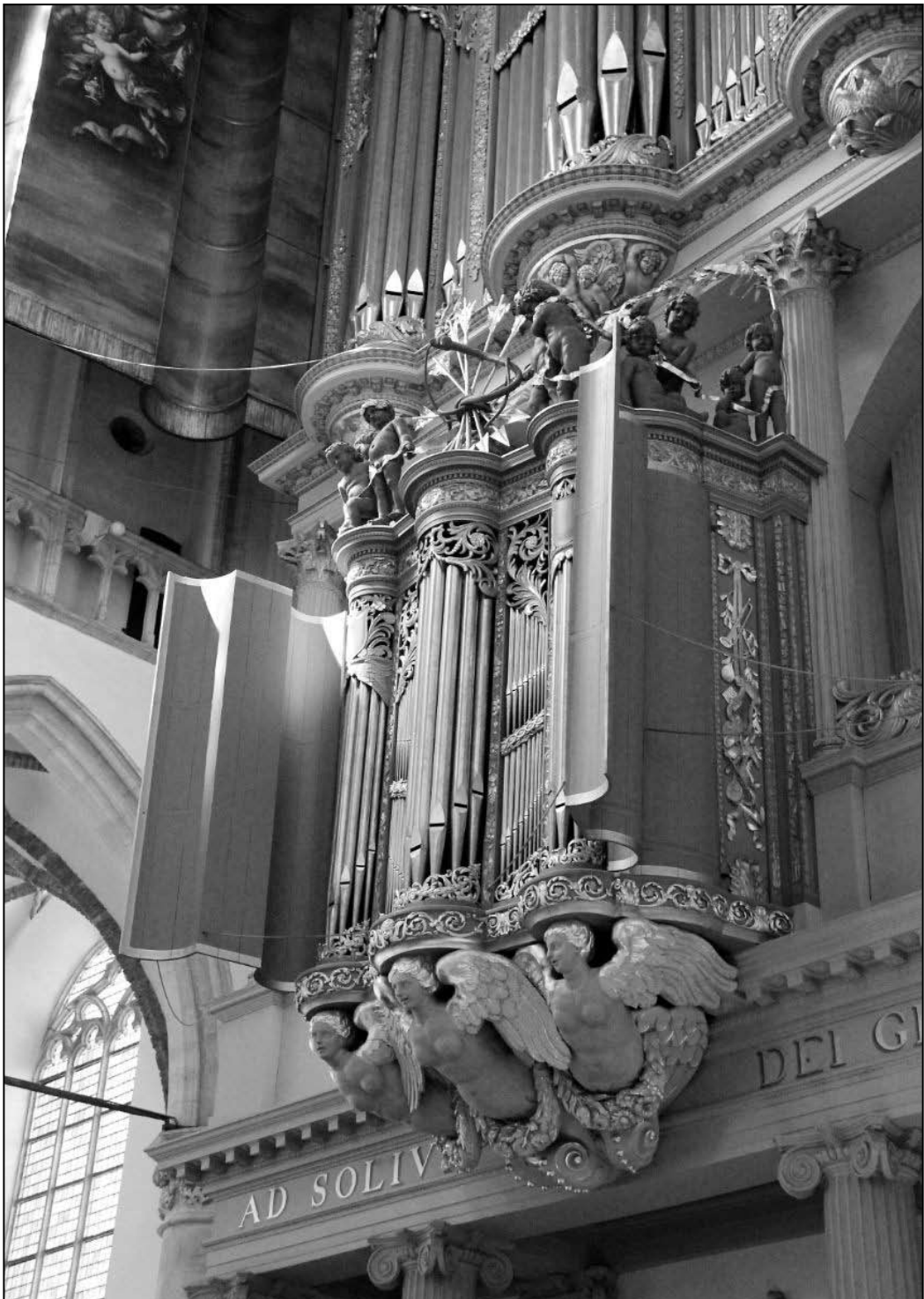
Ил. 5. Малий орган церкви Св. Лаврентія в Алкмарі [35]