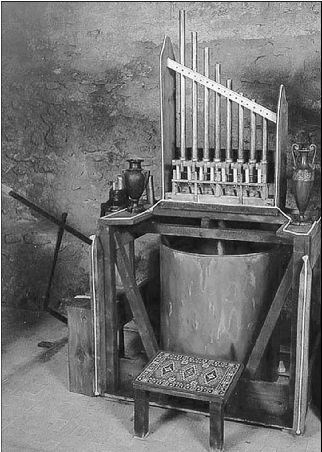
Іл. 1. Гідравлюс. Реконструкція. Швейцарський музей органа [19]