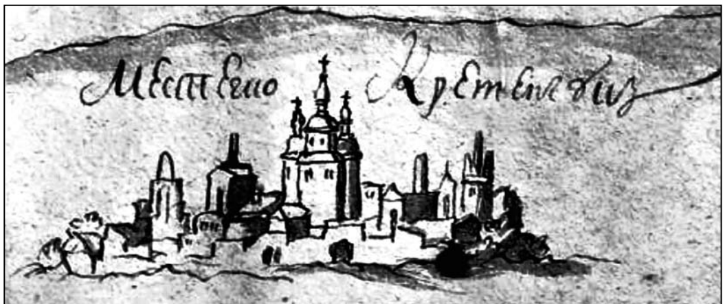
Ил. 1. Кременчуцька Спасо-Преображенська церква на мапі 1752 р. З книги Дмитра Вирського Новоросія Incognita: Кременчук 1764–1796 рр.

Оскільки храм був дерев’яний, з 26 березня 1736 р. Спаську церкву на Дніпрі перебудовують за “ветхістю” [1, с. 373]. Будівництвом переймався колишній сотник Кременчука Гаврило Ілляшенко [1, с. 389]. Новий храм простояв недовго – 8 вересня 1749 р. “попущенням Божим” “до фундаменту з усіма Церковними образами” церква згоріла [1, с. 331]. За коштами на відбудову погорілої церкви кременчуцька громада звернулася за посередництва Київської митрополії до “дателей” Запорозької Січі [1, с. 373]. І вже 1 вересня 1750 р. була освячена нова дерев’яна церква на честь і пам’ять Преображення Господа Бога і Спаса нашого Ісуса Христа архієпископом Тимофієм (Щербицьким), митрополитом Київським та Галицьким [4, с. 75] ( ил. 1 ).