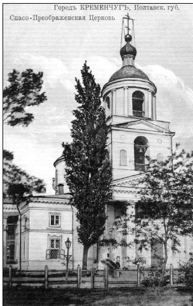
Іл. 4. Дзвіниця Кременчуцької Спасо-Преображенської церкви. Листівка, початок XX ст.

В головному іконостасі всі 38 ікон були в срібних та срібно-позолочених ризах. Серед них: образ Спасителя грецького письма, з вінцем, прикрашеним різнокольоровими камінцями; ікона Божої Матері в срібній ризі; храмова ікона Преображення Господнього, прикрашена ризою з фініфтою та зі срібно-позолоченим вінцем, усипаним білими стразами, встановлена в 1836 р.; ікони Стрітення Господне та Успіння Божої Матері; ікона Козельщанської Божої Матері –