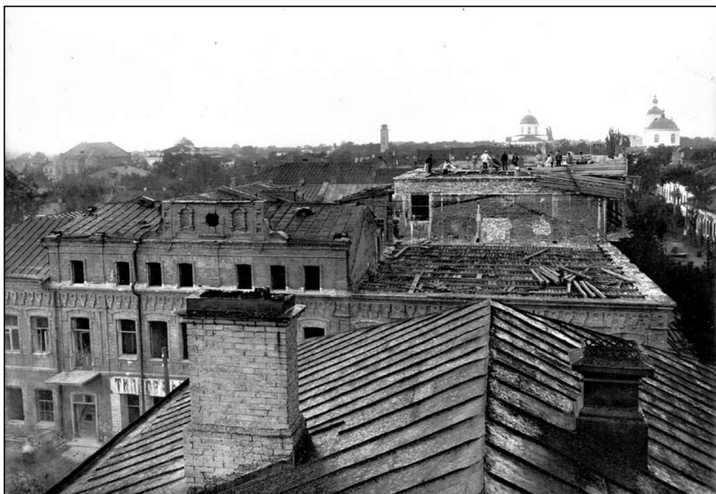
Іл. 9. Вид з дахів на Преображенський храм. Фото, 1926 р.