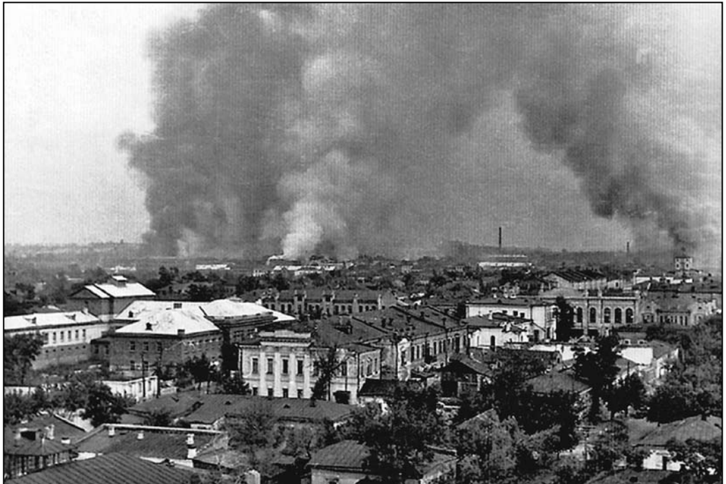
Іл. 10. Кременчук у вогні. Будівля з колонами – колишнє Духовне управління. Фото, 1943 р.

Поступово фінансування на утримання Будинку офіцерів зменшувалося, і в 1990-х рр. він мав жалюгідний вигляд. 10 листопада 1990 р. віруючі написали