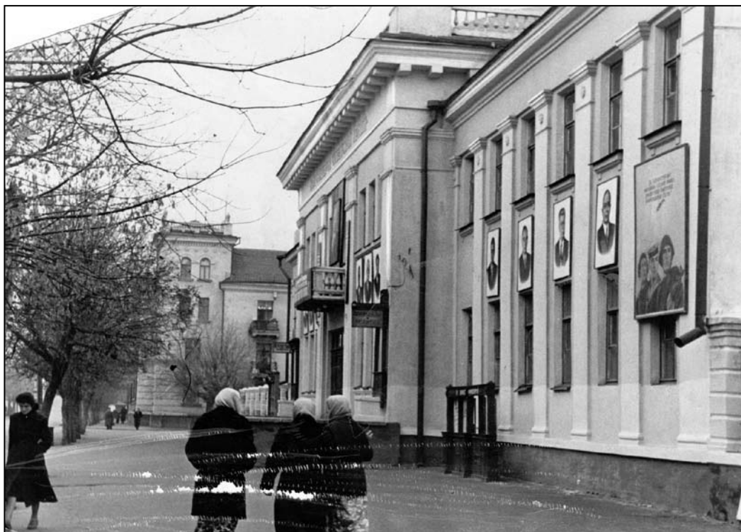
Іл. 11. Будинок офіцерів на місці колишньої Спасо-Преображенської церкви. Фото, 1959 р.

звернення до Кременчуцького виконкому про передачу релігійній громаді Будинку офіцерів на вул. Леніна, 7 (сучасна вул. Соборна), який практично стояв пустою, але від керівництва міста отримали відмову [78].