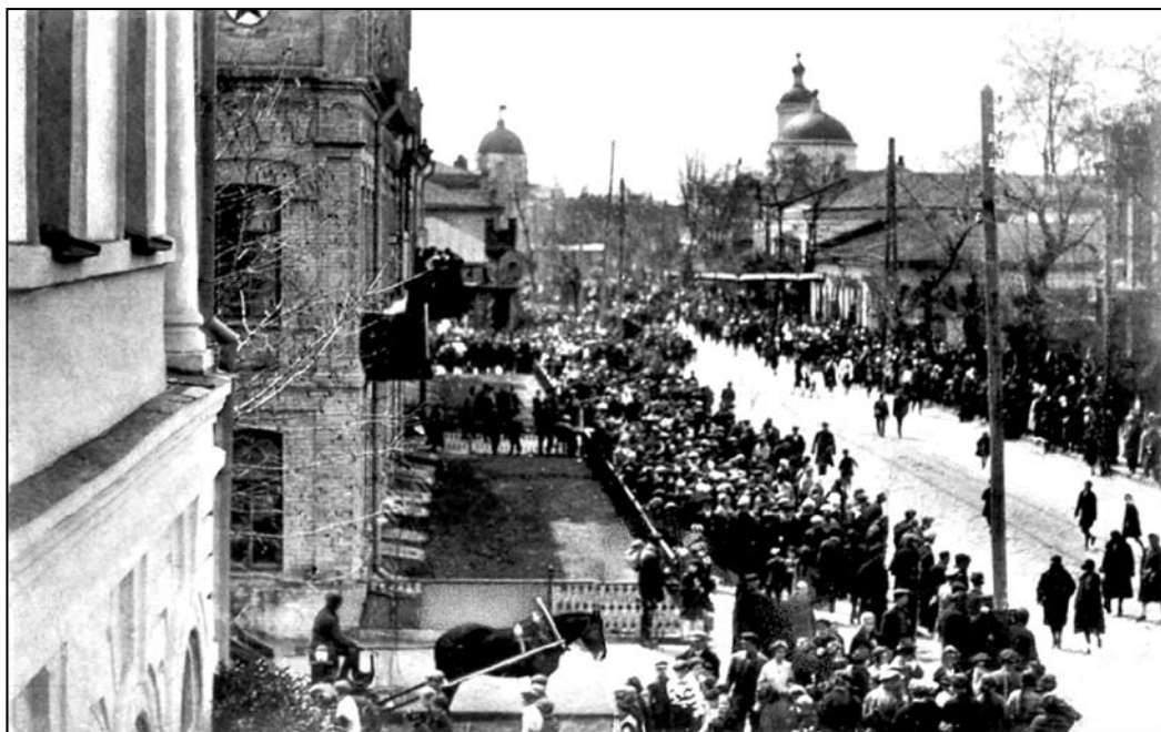
Іл. 8. Демонстрація по центральній вулиці Кременчука. Вид на Спасо-Преображенську церкву. Фото, 1935 р.