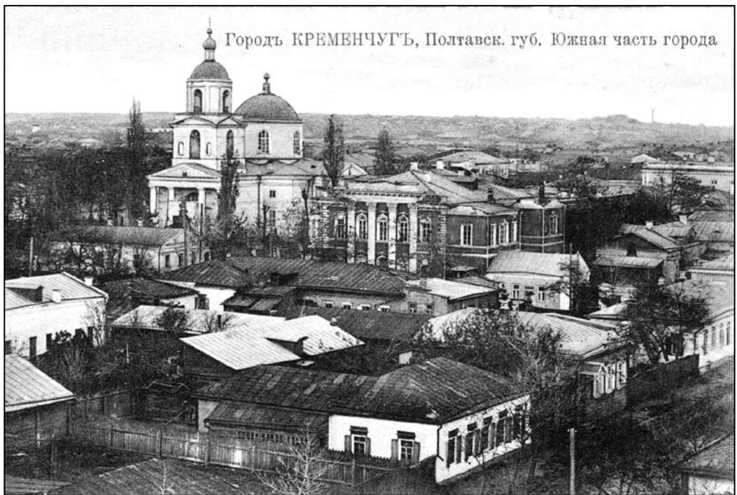
Іл. 3. Південна частина м. Кременчук. Вид на Спасо-Преображенський храм. Листівка, початок ХХ ст.

Віктора, архієпископа Чернігівського, а 26 вересня 1804 р. за благословення Преосвященного Сильвестра (Лебединського), єпископа Переяславського, церкву було освячено (іл. 3) [2].