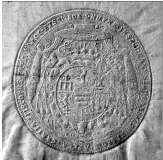
Печатка Онуфрія Шумлянського функціонувала у 1751–1761 рр.