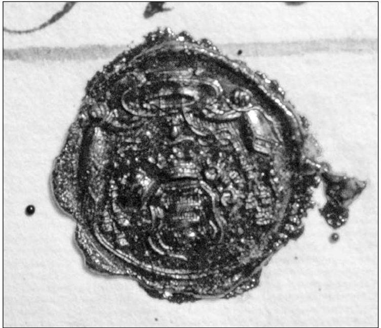
Печатка Онуфрія Шумлянського 1757 р.