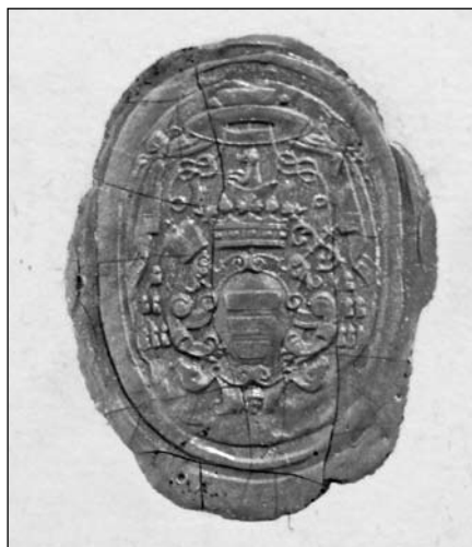
Печатка Онуфрія Шумлянського, 1945 р.