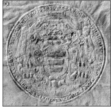
Печатка Онуфрія Шумлянського функціонувала у 1745–1760 рр.