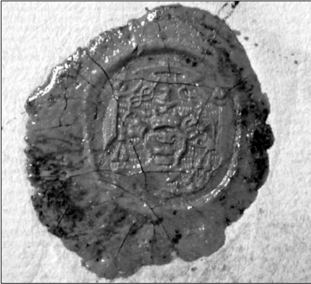
Печатка Онуфрія Шумлянського 1753 р.