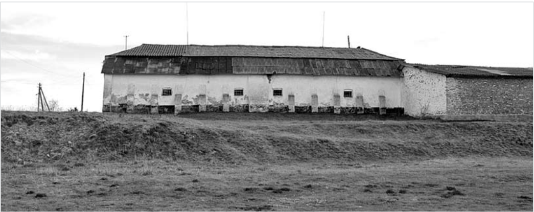
Іл. 2. Замок у с. Стратин. 2012 р.