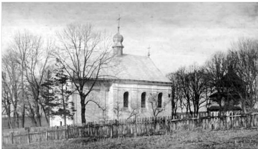
Іл. 5. Церква Успіння у Крилосі напередодні Першої світової війни.