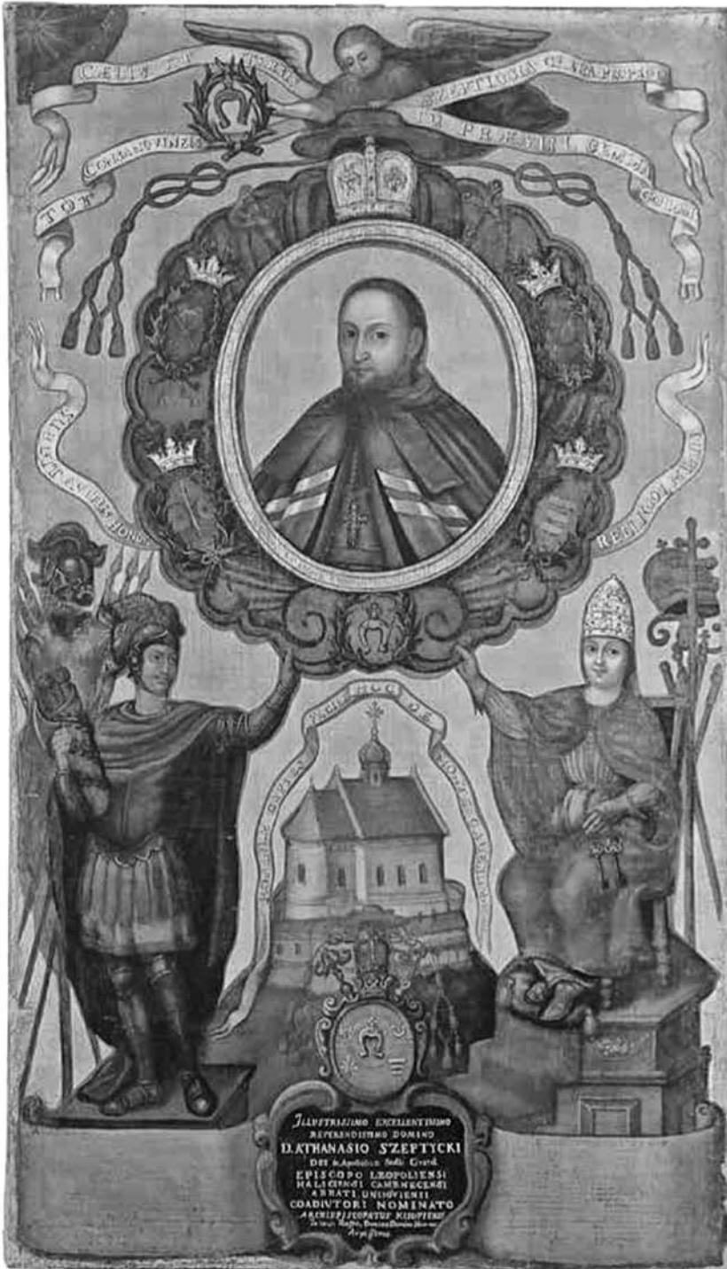
Іл. 1. Портрет-прославлення Афанасія Шептицького. 1729–1730 рр. Полотно, шовк, олія, 129×73 см. Фонди ЛМІР, Льв.Ма-1014 Ж-251.