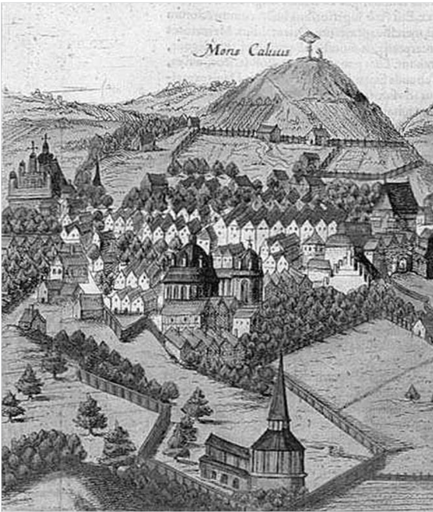
Гл. 4. Фрагмент панорами Львова А. Пассаротті/А. Гогенберга.

Александрович, 2013, с. 21). Локація резиденції єпископа з прибудованою до неї капличкою типу ротонди з наметовим дашком і дзвонами під ним була приблизно там, де тепер розташована будівля цирку.