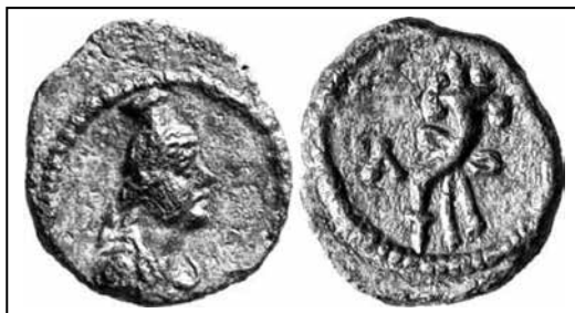
Іл. 10. Пантікапейська мідна 1 унція з рельєфом голови Серапіса, зі сайту “Монети Боспору” (№ 292-4722)