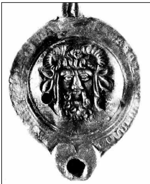
Ил. 5. Глиняний світильник із зображенням Зевса-Амона в клеймі з Херсонеса з монографії М. Кобиліної (1978) (№ 21)