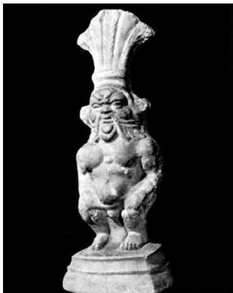
Лл. 3. Теракотова статуетка сидячого на пеньку Беса з Пантікапея, з монографії М. Кобиліної (1978) (№ 23)

з рогом достатку і в оголеному вигляді. Також тут є два сатири з атрибутами і гусак. Вперше за більш ніж 200-річну історію археологічних досліджень на території Боспорського царства знайдено кістяний рельєф у такому стані і прекрасному виконанні” [40].