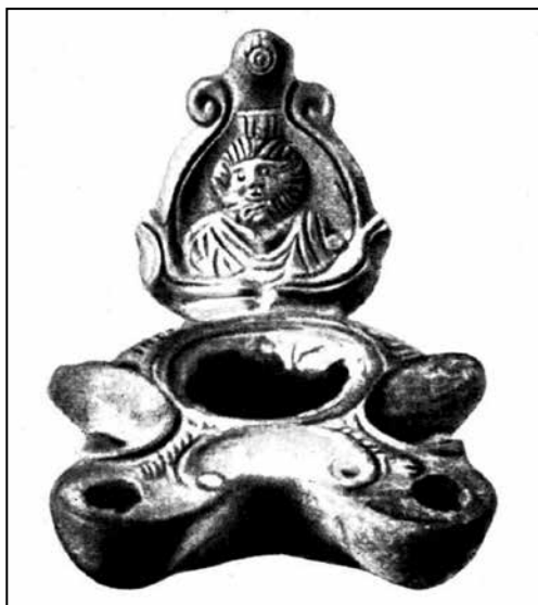
Лл. 6. Глиняний світильник із зображенням на ручці Серапіса з Пантікапея, з монографії М. Кобиліної (1978) (№ 4)