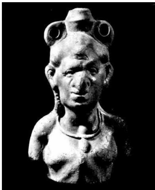
Ил. 4. Теракотова фігурна посудина у вигляді Патеки з Ольвії з монографії М. Кобиліної (1978) (№ 26)

Голова Зевса-Амона з баранячими рогами зображена на світильнику I ст. н. е. з Херсонеса [25, с. 132–3, № 21] (ил. 5).