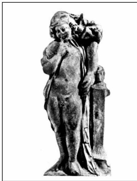
Іл. 2. Теракотова статуетка Гарпократа із рогом достатку з Пантікапея з монографії М. Кобиліної (1978) (№ 15)

лівій руці тримає великий ріг достатку. Вказівний палець його правої руки прикладений до вуст, на плечі накинутий плащ [25, с. 130, № 15] (іл. 2). Подібної форми є фрагмент статуетки Гарпократа (І ст. н. е.) місцевого виробництва, виявлений на території Кепів [25, с.130, № 16].