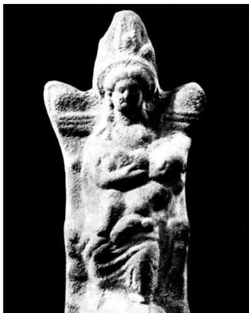
Іл. 1. Теракотова статуетка Ісіді із немовлям Гором з Пантікапея, з монографії М. Кобиліної (1978) (№ 10)