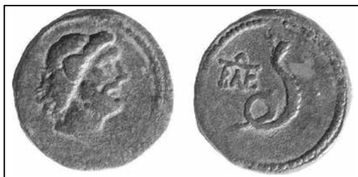
Іл. 9. Пантікапейські мідні 4 унції з рельєфом голови Зевса-Аммона, зі сайту “Монети Боспору” (№ 274-4703)

Монети. Зображення пов'язані з єгипетськими культурами можна зустріти на пантікапейських мідних монетах. З часу 2-го правління цариці Динамії (12/11 р. до н. е. – 7/8 р. н. е.) походять монети номіналом 4 та 1 унції. На лицевій стороні першої із них представлений рельєф голови Зевса-Аммона, на зворотній – змія (урея), ліворуч – монограма “BAE” 36 [3, № 274; 4, № 1378] (іл. 9). На лицевій стороні другої – голова Серапіса в модії, на зворотній – ріг достатку, прикрашений стрічками, ліворуч – монограма “BAE”, справа – “A”, на іншому різновиді такої ж монети – лише “A” ліворуч [3, № 283, 292; 4, № 1357, 1882; 19, таб. I, 28, 30, 33; 74, с. 49, X, 16–7] (іл. 10).