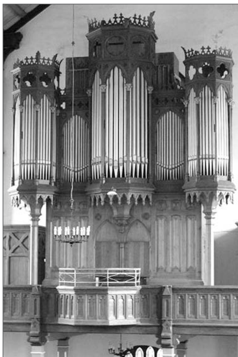
2. Prospekt organowy, Korzystno