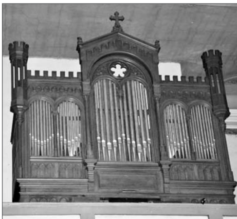
1. Prospekt organowy, Czaplinek

Obudowa instrumentu – prospekt organowy wraz z szafą organową (fot. 3.) został zaprojektowany przez Karla Johanna Bogislawa Lüdecke 3 w