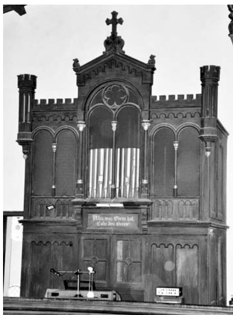
4. Prospekt organowy, Bobolice