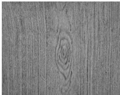
5. Zbliżenie mazerunku, Czaplinek