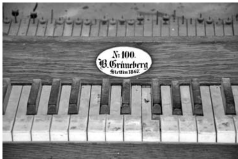
6. Zbliżenie mazerunku i tabliczka nad drugim manuałem, Korzystno

głównie na terenach Pomorza Zachodniego, a także Niemieckich i Łotewskich 4 .