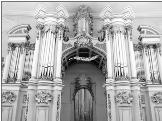
5. Орган з Домініканського собору.

дружина В. Бакєєва виступали з концертами, які з ентузіазмом відвідували львів'яни. Декілька студентів консерваторії факультивно проходили курс гри на органі. Однак через те, що орган при перестановці був змонтований по-іншому, ніж в автентичному варіанті, через сухе повітря в залі дуже часто виникали ава-