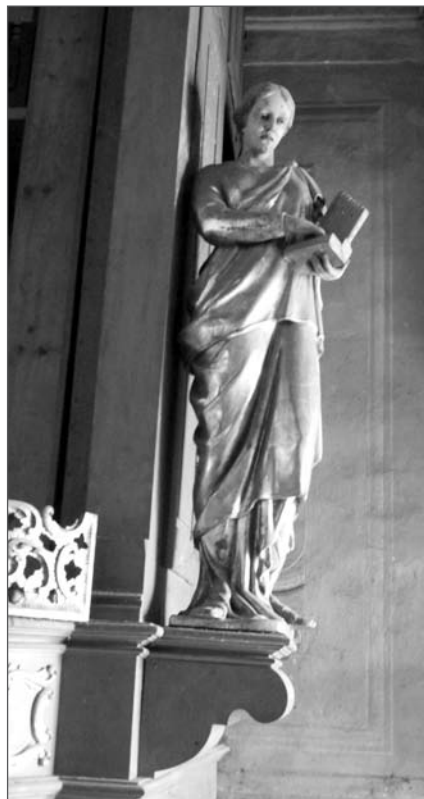
4. Свята Цецилія з органчиком.

За переміщення домініканського органа до консерваторії взявся органний майстер Пшитульський, який мав деякий досвід з передвоєнних часів. По висоті домініканський орган не вмещався на сцені, тому найвищу секцію фасаду розмістили внизу, за пультом. Труби лютеранського органа розмістити було ніде. Вихід знайшли: труби і механіку встановили над сценою, на стриху, в стелі пробрили отвір для з'єднання секцій органа і проходження звуку. Врешті орган зазвучав (Рис. 5). Час від часу А. Котляревський і його