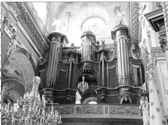
1. Орган з костелу бернардинів.

ною характеристикою інструменту. Принаймні так виглядає справа у львівських архівах. І нічого дивного в тому нема, адже багато церковних документів було вивезено, не менше безслідно зчезло. Тому під час підготовки цієї роботи було використано матеріали львівського дослід-