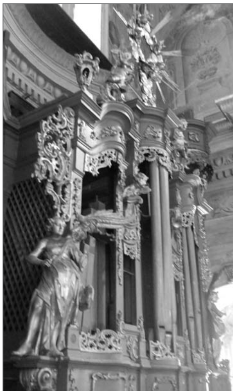
3. Фасад органа Єзуїтського костелу.

фаника, яке налічувало понад два мільйони книг. Напередодні двадцятої річниці створення Збройних сил України книги з костелу нарешті вивезли до іншого сховища. Колишній Єзуїтський костел урочисто освятили і передали Львівській митрополії УГКЦ. Тепер тут діючий гарнізонний храм апостолів Петра і Павла. А від органа залишилися трьохповерхові міхи, пульт, система управління, частина дерев'яних і декілька металевих великих труб. Повністю зберігся фасад органа (Рис. 3). Особливо гарними на ньому є позолочені фігурки з екзотичними музичними інструментами в руках: цар Давид з лірою, свята Цецилія (покровителька органістів) — з органчиком (Рис. 4) та дві музи — з мандоліною та флейтою.