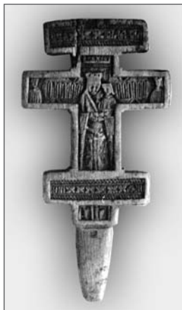
Рис. 1. Дерев'яний ручний хрест. Тербовлянський р-н, с. Бурканів. ХІХ ст. ТКМ інв. №ТКМД – 69.