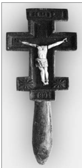
Рис. 2. Дерев'яний ручний хрест. Густинський р-н, с. Монастириха. 1893 р. ТКМ інв. №ТКМД – 227.

рельєфними мініатюрними зображеннями, написами, геометричними візерунками. Дослідник виробів з дерева М. Є. Станкевич визначає осередки різьблення ручних хрестів західних областей України шляхом іконографічного, хронологічного і стилістичного аналізу творів. На теренах Західного Поділля виокремлюються два осередки у селі Кошилівці Заліщицького району Тернопільської області (ХІХ — початку ХХ ст.) та селі Золотий Потік Буцацького району (друга половина ХІХ ст.); вирізняється різьблення золотопотіцького майстра, для якого характерне профілювання, глибока виїмчасста різьба в поєднанні з плоскою різьбою. Велику групу ручних хрестів становлять хрести першого стилістичного пласту — народного з виявом “примітиву” в техніці виконання у способі інтерпретації фігур зі збірки Тернопільського краєзнавчого музею. Ці твори датовані серединою і кінцем ХІХ ст. і складають чотири типи загальної форми хрестів: чотирикінцевий, шестикінцевий, семикінцевий з подовженою середньою поперечкою і рівними раменами.