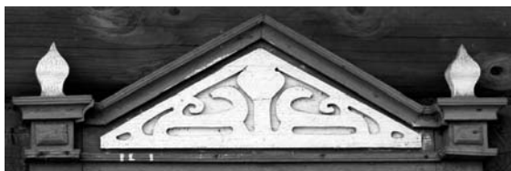
г. Едлін Пухавіцкага р-на Мінская вобл.