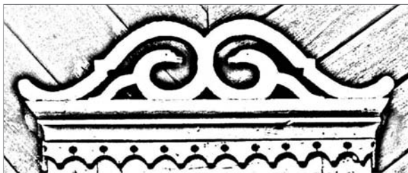
в. Горкі Чэрвенская р-на Мінскай вобл.

у выглядзе дзвюх валютападобных завіткаў, якія заканчваюцца вужынымі ці змяінымі галоўкамі (часам тэраталагічны матыў набывае рысы антрапаморфнага) 12 . Месцамі “вужыныя”