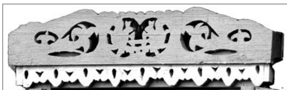
в. Я. Слабада Клічэйскага р-на Мінская вобл.