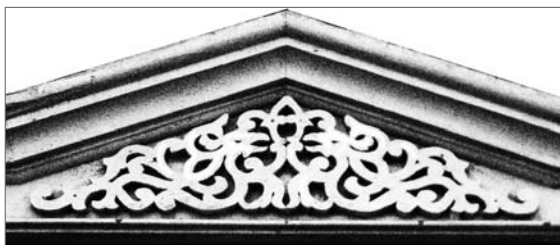
г. Червень Мінская вобл., вул. Мінская, д.7