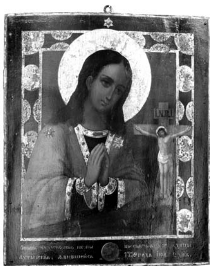
6. Бунаков К. Охтирська ікона Богородиці. 1858. Д. О. Чугуївський художньо-меморіальний музей І. Репіна.

Менш поширеними були Смоленська та Казанські образи Богородиці. В експозиції ЧМР зберіга-