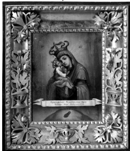
13. Невідомий чугуївський майстер. Почаївська ікона Богородиці. Друга половина XIX ст. Д. О. Чугуївський художньо-меморіальний музей І. Репіна.