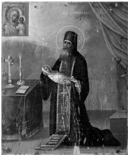
10. Невідомий чугуївський майстер. Св. Устоліан. Друга половина XIX ст. Д. О. Чугуївський художньо-меморіальний музей І. Репіна.