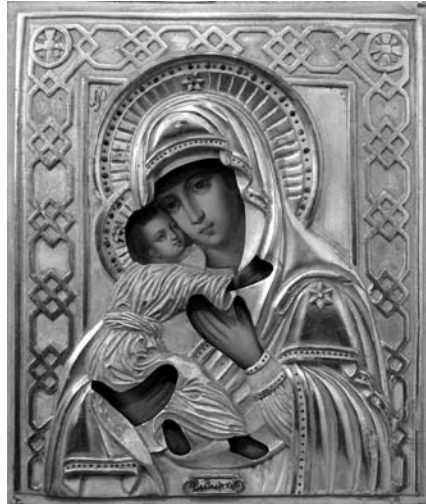
2. Нечитайло (Нечитайлов) І. Володимирська-Чугуївська ікона Богородиці. 1874. Д. О. Чугуївський художньо-меморіальний музей І. Репіна. Фото Шуліки В.В.

чугуївського феномена зовсім не виявлено списків особливо шанованих харківських ікон Богородиці, як-от Озерянська та Єлецька.