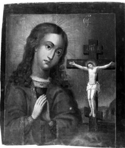
7. Невідомий чугуївський майстер. Охтирська ікона Богородиці. Середина XIX ст. Д. О. Приватна збірка (м. Харків).