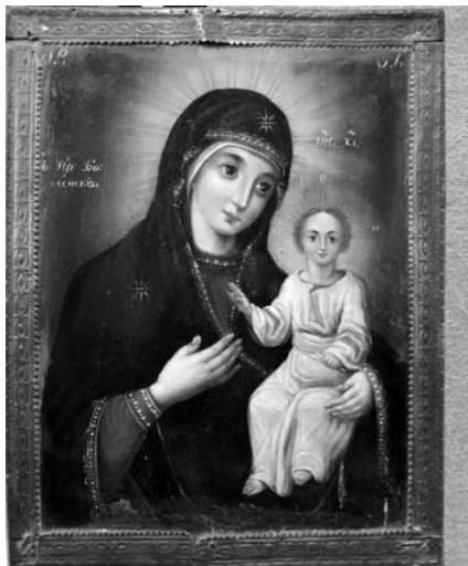
8. Невідомий чугуївський майстер. Смоленська ікона Богородиці. Друга половина XIX ст. Д. О. Чугуївський художньо-меморіальний музей І. Репіна.