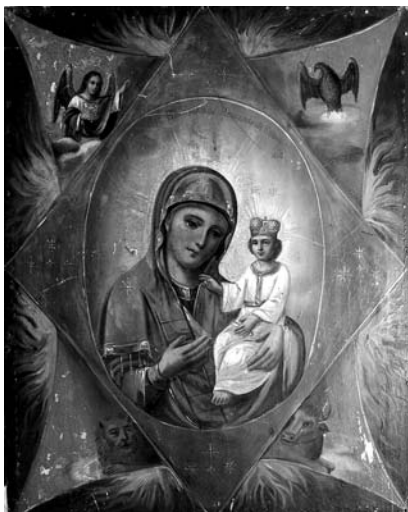
12. Невідомий чугуївський майстер. Ікона Богородиці "Неопалима Купина". Друга половина XIX ст. Д. О. Харківський художній музей.