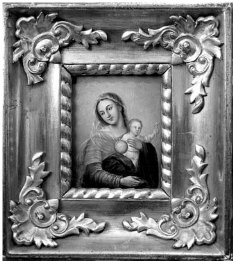
14. Невідомий чугуївський майстер. Богородиця з Немовлям. Друга половина XIX ст. Д. О. Чугуївський художньо-меморіальний музей І. Рєпіна.

Богородиці “Неопалима Купина”. На Слобожанщині цей образ почали особливо вшановувати після 1822 р., коли м. Слов’янськ було врятовано від пожежі. Характерною іконографічною деталлю слобожанських, зокрема чугуївських, ікон стало близьке до Озерянської ікони Богородиці зображення Богонемовляти (показано лише ліву стопу Дитяти, права стопа схована). У ЧМР є також ікона майстра В. М. Івженка, яка демонструє чугуївську традицію художньої інтерпретації “Неопалимої Купини” (іл. 11). Ще одна чугуївська ікона цього типу зберігається в Харківському художньому музеї (іл. 12).