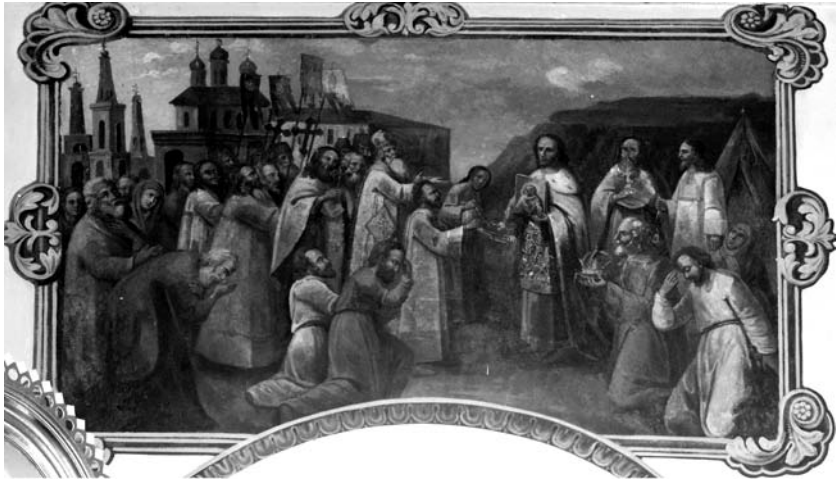
5. Невідомий чугуївський майстер. Хресний хід з чудотворною Володимирською-Чугуївською іконою. Середина XIX ст. Розпис Володимирського храму в с. Кочеток Чугуївського р-ну Харківської обл.

такого типу, виявлена співробітниками музею в с. Кам'яна Яруга Чугуївського району (іл. 4). На ній подані фігури св. муч. Агафії та св. муч. Микити, над якими у хмарах підноситься Володимирська ікона Богородиці. Зображений тут краєвид типовий для Чугуєва та його околиць.