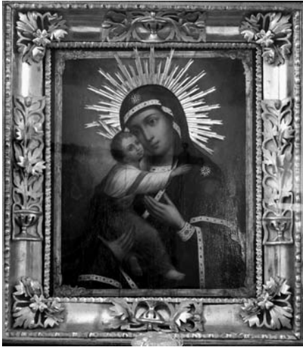
1. Репін І. Ю. (?) Володимирська-Чугуївська ікона Богородиці. 1859 (?). Д. О. Чугуївський художньо-меморіальний музей І. Репіна.