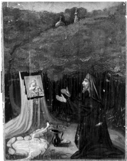
3. Невідомий чугуївський майстер. Набуття Володимирської-Чугуївської ікони Богородиці. Друга половина XIX ст. Д. О. Чугуївський художньо-меморіальний музей І. Репіна.