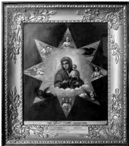
11. Івженко В. Ікона Богородиці "Неопалима Купина". Друга половина XIX ст. Д. О. Чугуївський художньо-меморіальний музей І. Репіна.