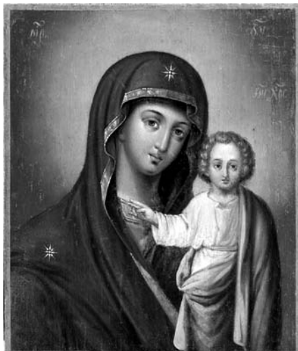
9. Невідомий чугуївський майстер. Казанська ікона Богородиці. Друга половина XIX ст. Д. О. Чугуївський художньо-меморіальний музей І. Репіна. Ікону від-реставровано на кафедрі Реставрації станкового та монументального живопису Харківської державної академії дизайну і мистецтв.

ється Смоленська ікона Богородиці. Божа Матір зображена на ній у синьому мафорії, а Богонемовля — у білих одежах (іл. 8). Необхідно зазначити, що Смоленський образ шанувався в Харкові. Під час пожежі в харківському Свято-Димитрівському храмі ця ікона залишилася неушкодженою. Проте, стверджувати, що цей чугуївський список пов'язаний із харківською святинєю, передчасно.