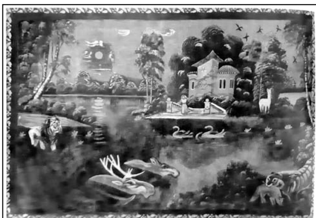
Ил. 7. Расписной ковер. М. П. Сазанович. 1950-ые гг. Холст, масло, роспись. 130×188 см. Из д. Рожавка, Наровлянский р-н Гомельской обл.