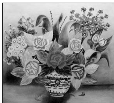
Ил. 2. Натюрморт с розами и хризантемами. Худ. Н. Л. Зосик. 1950–1960-е гг. Холст, масло. 62,0×69,5. Из д. Закозель, Дрогичинский р-н Брестской обл.