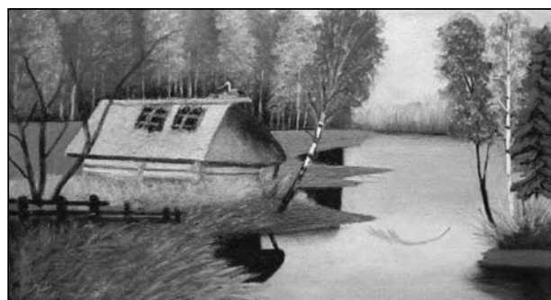
Ил. 4. Дом на берегу. Худ. Н. Л. Зосик. 1950–1960-е гг. Холст, масло. 35,0×55,5. Из д. Закозель, Дрогичинский р-н Брестской обл.