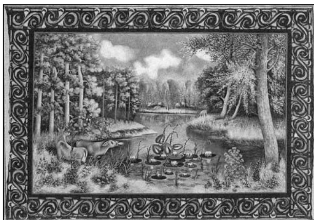
Ил. 3. Расписной ковер “Лесное озеро”. 1950-е гг. Худ. Н. Л. Зосик. Клеенка, масло. 118,0×176,5. Из д. Закозель, Дрогичинский р-н Брестской обл.