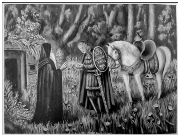
Ил. 5. Благословение на подвиг. М. П. Сазанович. Сер. XX в. Холст, масло, 92,5×69,0. Из д. Вавуличи, Дрогичинский р-н Брестской обл.

любимым занятием – живописью. Его работы по сей день хранятся у местных жителей. Часть картин была привезена сотрудниками отдела древнебелорусской культуры из экспедиции по Брестчине.