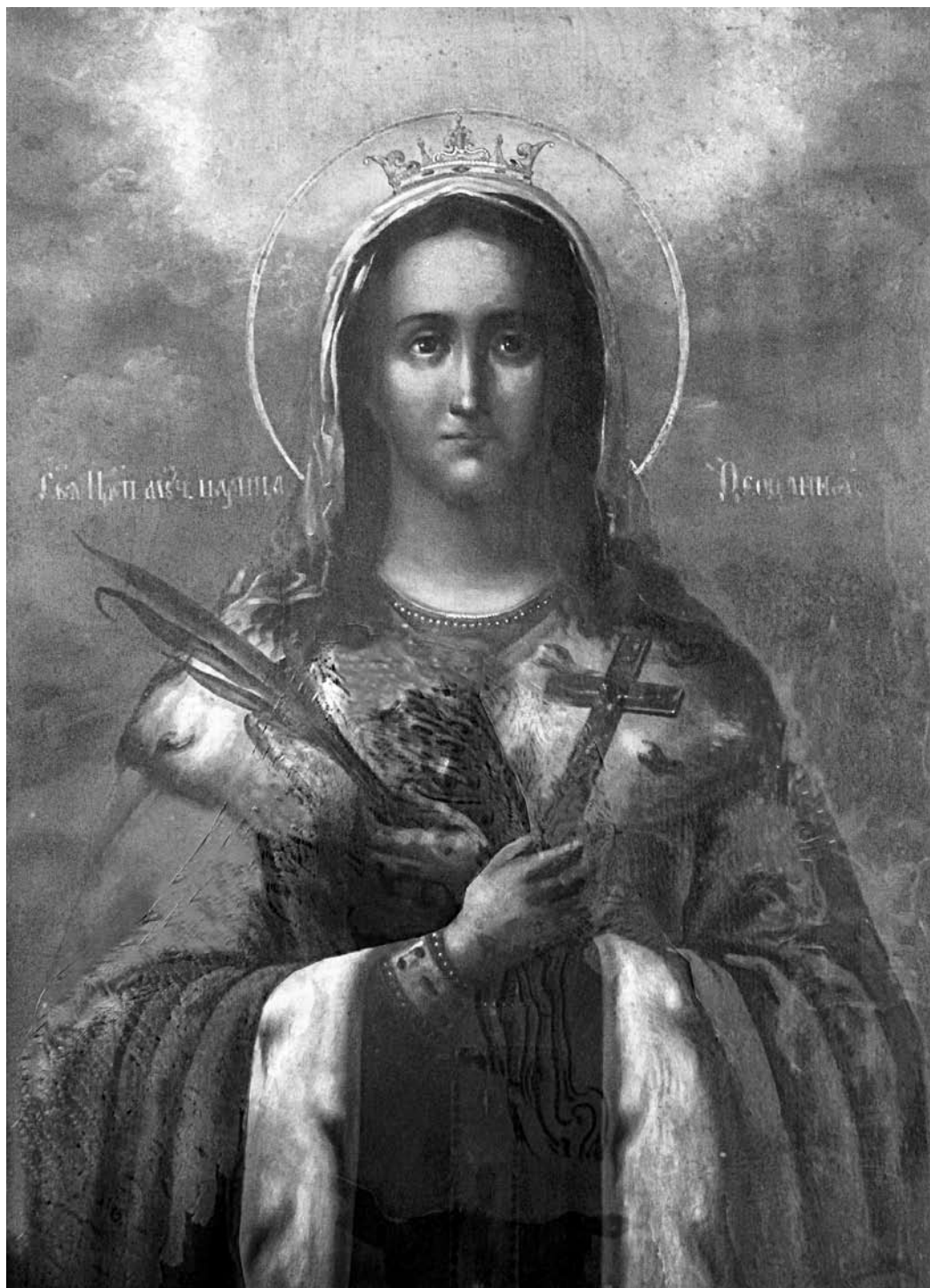
Гл. 7. Блажэнная царыца Феафанія. Вілейскі раён Мінскай вобл., другая палова XIX ст., дошка, алей, 65×48