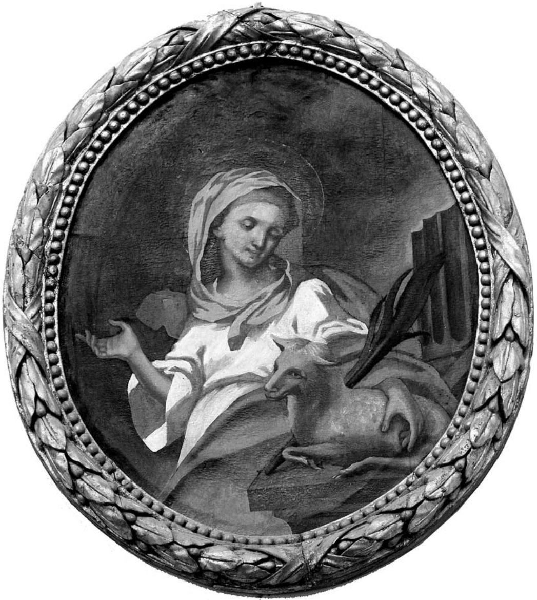
Іл. 5. Агнэса Рымская. Мядзельскі раён Мінскай вобл., канец XVIII ст., палатно, алей, 80×60

На абразях пакутніца Аляксандра звычайна падаецца ў царскім аблачэнні, з каронай на галаве, як на творы з Валожынскага раёна Мінскай вобл. ( іл. 6 ). На іншых абразях з роставай выявай св. Аляксандры яна трымае ў руцэ крыж, а на абразе з г. Ракаў Валожынскага раёна Мінскай вобл. (XIX ст., палатно, алей, 107×71) правай рукой абапіраецца на меч, а ў левай трымае пальмавую сцябліну.