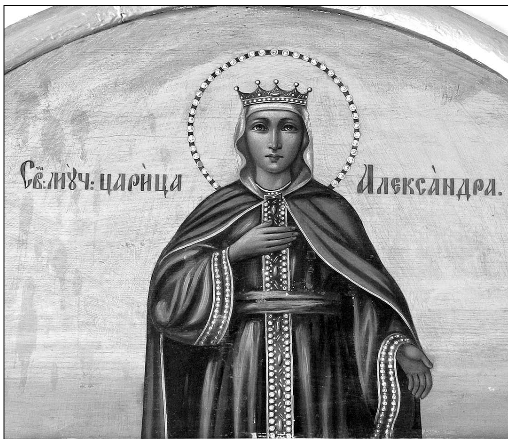
Іл. 6. Пакутніца Аляксандра. Валожынскі раён Мінскай вобл., XIX ст., палатно, алеі, 43×80

Праваслаўная святая Блажэнная царыца Феафанія таксама была царыцай і першай жонкай імператара Ільва VI Мудрага. Па абгавору правяла разам з мужам (тады яшчэ наследнікам прэстолу) тры гады пад хатнім арыштам. Стаўшы царыцай, вяла праведнае жыццё ў малітвах і цялесных абмежаваннях. Апошнія гады жыла ў манастыры, не прымаючы пострыгу. Памерла Феафанія ў 893 ці 894 г. Адразу пасля смерці яна праславілася цудамі і неўзабаве была кананізавана.