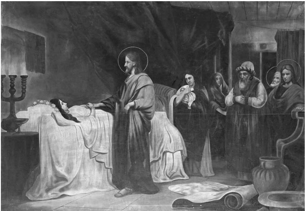
Іл. 1. Уваскрэсенне дачкі Іяіра. Г. Орша Віцебскай вобл., канец XIX ст., палатно, алей, 130×190)

Даволі рэдкім іканаграфічным сюжэтам для Беларусі з’яўляецца “ Сабор (Дзень) Усіх Святых ” – хрысціянскае свята ў гонар памяці ўсіх шанаваных царквою святых, як кананізаваных, так і тых, хто застаўся невядомым пры