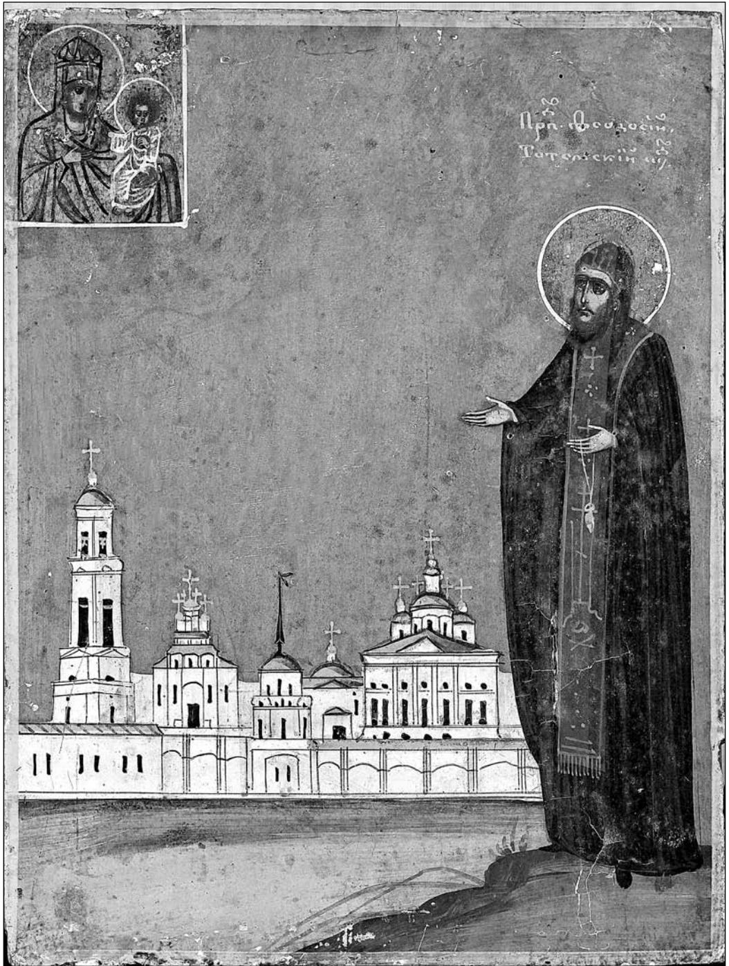
Іл. 4. Прападобны Феадосій Татэмскі (Суморын). XIX ст., дошка, алей, 17×13