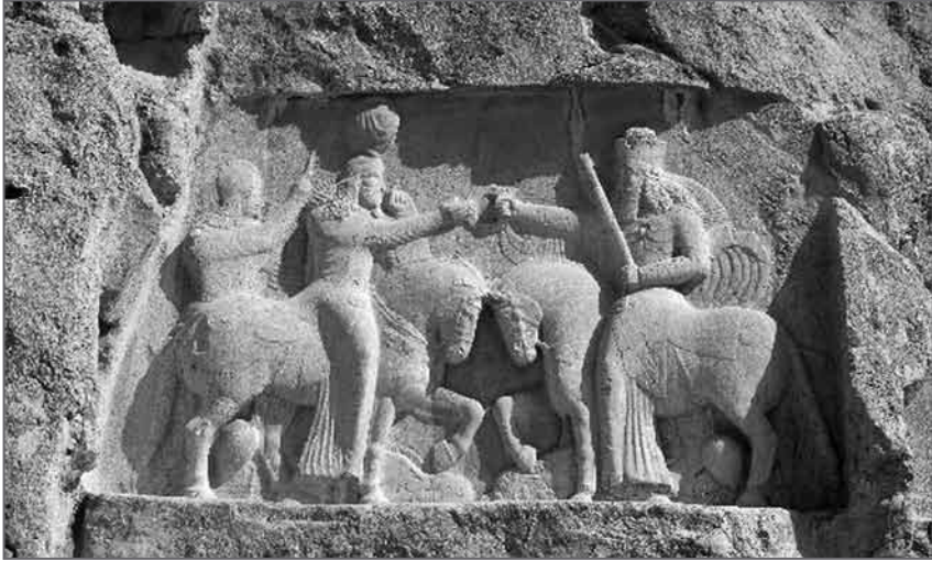
Il. 2. Obraz boga w Naqsz-e Rustam