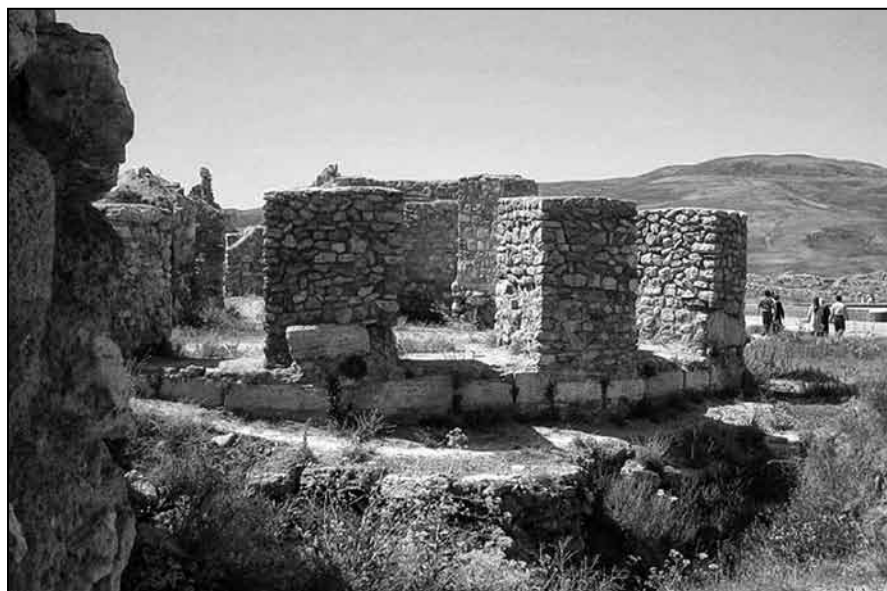
Il. 5. Ruiny świątyni ognia (zaczepnięte ze strony internetowej: https://en.wikipedia.org/wiki )