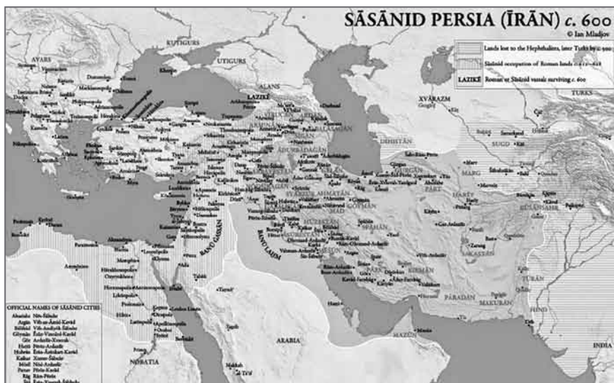
Il. 1. Mapa Persji Sasanidzkiej (224–651)

Pierwszym władcą Sasanidzkim był Ardaszir I. Był on synem Papaka, zarządcy Farsu, który zbuntował się przeciwko rządzącej dynastii Achemeni-dów. Szapur I, wnuk Papaka, a syn Ardaszira przedstawiał się następującymi słowami: «Jestem wyznawcą Ahuramazdy, królem Szapurem, władcą Iranu i Nieiranu, boskiego pochodzenia, synem czciciela Ahuramazdy, władcy Ardaszira (...)» [6, s. 225].