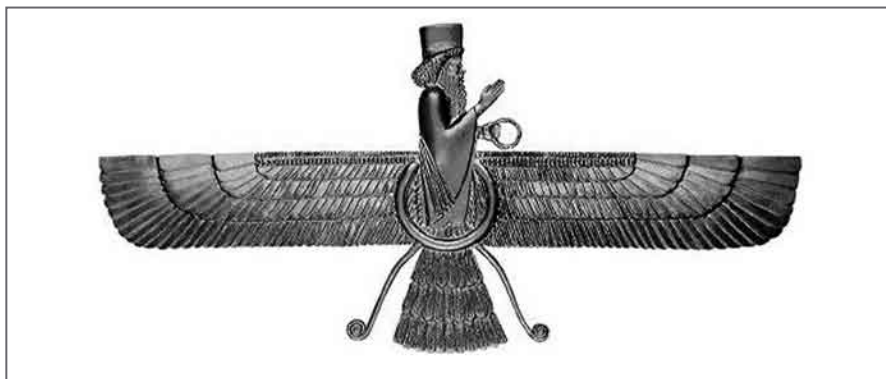
Il. 11. Fravahar wyznawców zoroastrianizmu

Śmierć była bardzo ważna w religii zoroastriańskiej. Zgon wiązał się z przejściem duszy przez most, strzeżony przez dwa psy, na końcu którego stał Mitra i decydował, czy zmarły pójdzie do nieba, czyśca czy piekła. Na jego decyzję wpływały uczynki, popełnione za życia zmarłego. Zwłoki uważane były za nieczyste, dlatego też nie mogły zostać złożone bezpośrednio do ziemi, aby jej nie skałać. W związku z tym ciało wystawione było na specjalnej platformie, na której przez 3 dni było rozszarpywane przez dzikie zwierzęta i ptaki drapieżne. Po tym czasie, kości były składane w specjalnych wieżach, tzw. wieżach milczenia. Dostęp do nich miał jedynie specjalnie wyselekcjonowany kapłan, sprawujący rolę grabarza. W momencie, gdy nie było możliwości chowania w wieży, Persowie chowali ciało w ziemi «obciążnawszy je naprzód woskiem» [3, s. 73]. Dzisiejsze pochówki wyznawców zaratusztriańskich odbywają się w betonowych lub metalowych trumnach, tak aby pozostawić ziemię nieskałą.