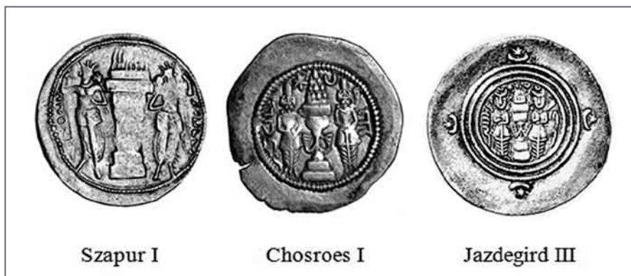
Il. 6. Szapur I