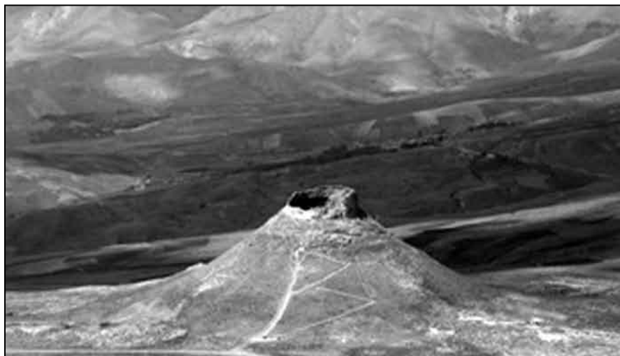
Il. 4. Krater Takht-e Soleyman