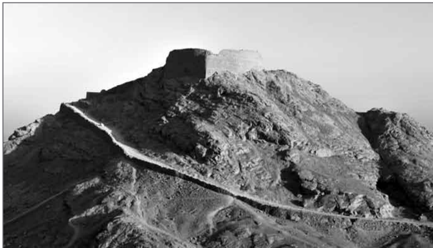
Il. 9. Wieża milczenia w Jazd, Iran