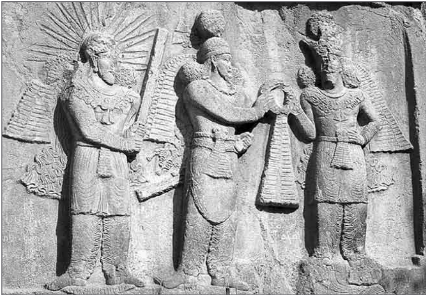
Il. 3. Obraz boga w Taq-e Bostam