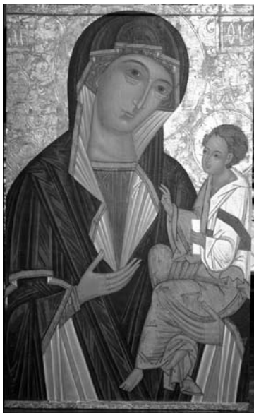
Богородиця Одигітрія Єрусалимська. Початок XVI ст. Ікона з церкви Різдва Богородиці в Камені-Каширському на Волині. Дерево, жовткова темпера