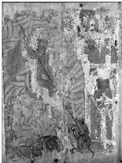
Святий Георгій Змієборець. XVI ст. Дерево, левкас, темпера. Ікона зі збірки Волинського краєзнавчого музею