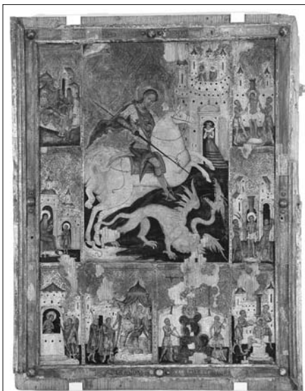
Волинський іконописець 1630 року. Святий Георгій Переможець з житієм. 1630 р. Дерево, левкас, темпера. Ікона зі збірки Волинського краєзнавчого музею

лабораторні дослідження левкасу, фарбового шару і покривного лаку (мікроскопічні і мікрохімічні) на ідентифікацію 12 .