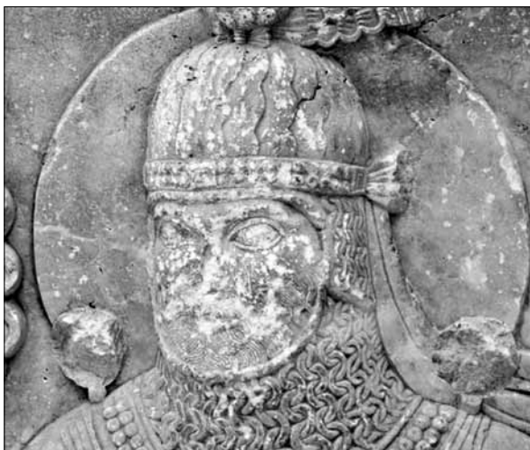
Il. 2. Hełm ukazany na kapitelu znajdującym się obecnie w Ṭāq-e Bostān , VI wieku naszej ery.

Czy można jednak odnosić tak późne elementy w sztuce do tak odległych czasów? Wydaje się to prawdopodobne. Z jednej strony wiemy, że kościół etiopski miał kontakty z kościołami wschodnimi, w tym z Persji i Indii, w okresie późno-sasanidzkim 9 . Z drugiej strony znana jest absorpcja dekoracyjnych tiar, nazywanych mitrą ( infula ), 10 początkowo przez Kościół Wschodnie, a następnie z Cesarstwa Bizantyjskiego do Kościoła Rzymsko-Katolickiego. Wydaje się być interesujące, że jeszcze w XI wieku naszej