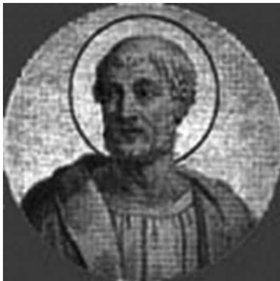
Іл. 1. Святий великомученик папа Климент

За іншими даними Климент народився у 30 р. і помер мученицькою смертю у 92 р. Деякі дослідники заперечують