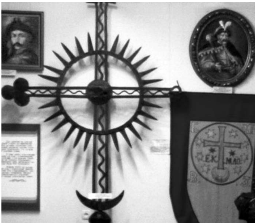
Іл. 4. Запорізький хрест-якір і прапор війська Богдана Хмельницького в експозиції Нікопільського краєзнавчого музею

цього викутого із заліза хреста завершують трилисники, а в центрі його розташоване сонце. Поруч з хрестом в експозиції знаходиться автентична копія прапора війська Богдана Хмельницького (оригінал в королівському військовому музеї м. Стокгольма), на якому теж центральною фігурою виступає хрест якірного типу (іл. 4).