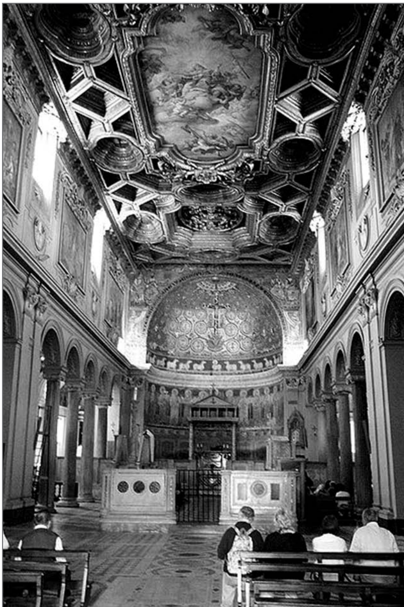
Лл. 3. Головний вівтар і хори Базиліки Святого Климента у Римі