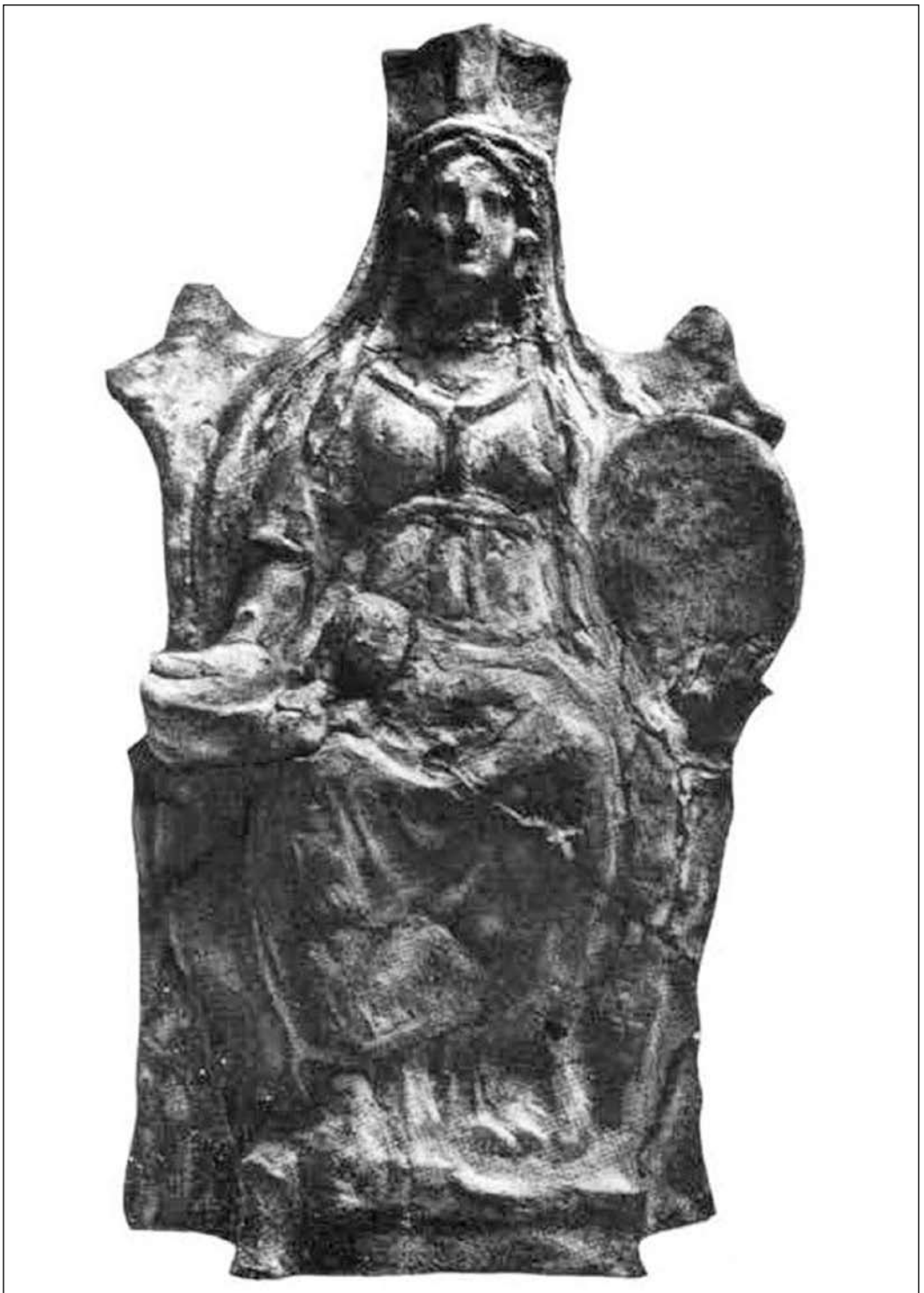
Гл. 1. Матір богів, III ст. до н. е., Ольвія (за СССА, VI, 513)