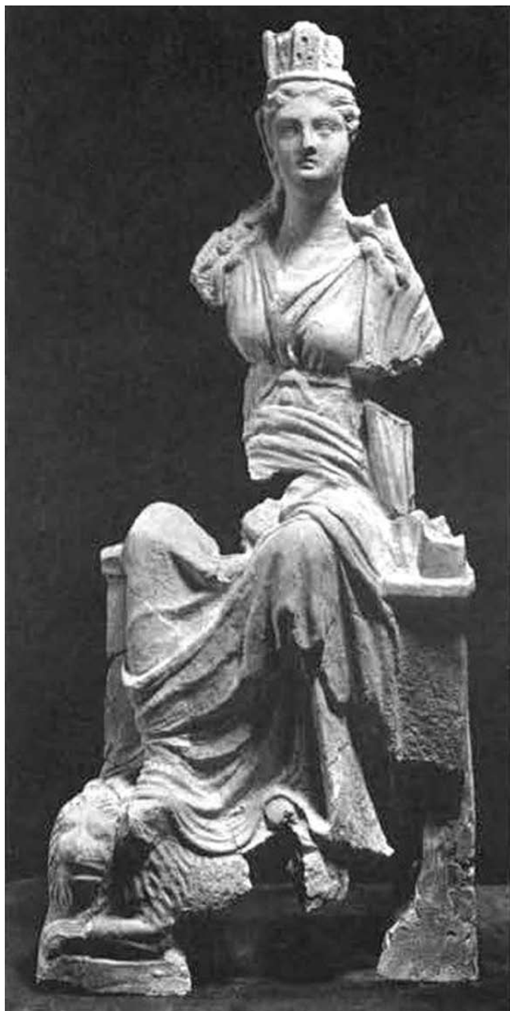
Іл. 4. Матір богів, II ст. до н. е., Мірмекій (за СССА, VI, 593)