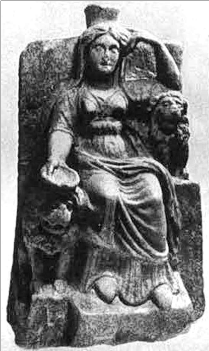
Іл. 5. Кібела з двома левами, I ст. до н. е. – II ст. н. е., Пантікапей (за СССА, VI, 579)