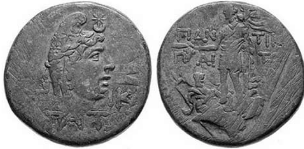
Іл. 4. Зображення пантікапейського мідного обола із сайту “Монети Боспору” (№ 201-3019)

його ідентифікують, є розміщена вище чола чоловіка невелика восьмипроменева зірка, обрамлена знизу маленьким півмісяцем [7, с. 185–187, табл. XLIII, № 13–14; 12, Пантікапей № 201–3019, Фанагорія № 207–3200, Горгіппія №№ 210–3140, 210–3284] (іл. 4–5).