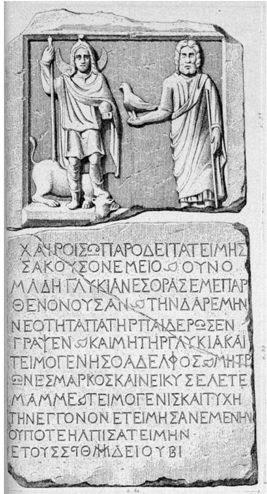
Іл. 1. Стела із зображенням Мена та Зевса Масфалатеноса з книги “Археологічна подорож до Греції та Малої Азії...” (1888) 5

В іконографії Мен зазвичай одягнений у фрігійський костюм – оздоблену зірками шапку із закрученим до переду верхом і туніку з високо розміщеним поясом. Його завжди зображують безбородим юнаком, часто з довгим волоссям, що спадає на плечі. Здебільшого він тримає в лівій руці гачок або шишку, яка розганяє злі чари, або кулю – символ влади. Його друга рука спирається на спис [21, р. 104] (іл. 1).