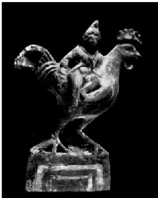
Іл. 7. Зображення статуетки одягненого у фрігійську одягу хлопчика з Пантікапея з книги М. Кобиліної (1978) (№ 30)

Всупереч вищевказаному твердженню, можна навести цілий ряд аргументів на користь того, що ці статуетки навряд чи можна пов’язувати із культом бога Мена: