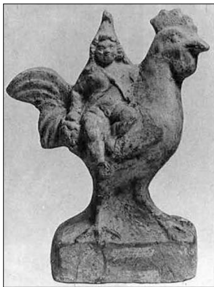
Іл. 8. Зображення статуетки одягненого у фригійську одягу хлопчика з Пантікапея, з книги М. Й. Вермасерена (1989) (№ 575)

у Пантікапеї, Фанагорії та Горгіпії мідних об'єктах зображений, скоріш за все, не Мен, а цар Понту – Мітрідат VI Євпатор в образі бога Мітри. Поява таких монет у Боспорському царстві може свідчити хіба що про поширення культу цього правителя у підвладному йому регіоні.