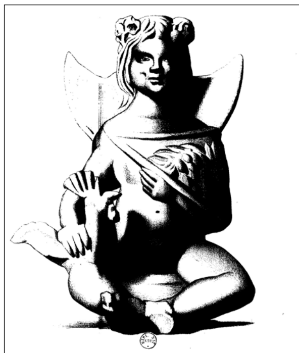
Іл. 3. Зображення статуетки Мена-дитини із статті Г. Шлюмбергера (1880)

Традиційно вважається, що дитячих зображень Мена не існує, однак є один цікавий виняток. Мова йде про теракотову фігурку, що походить з Лідії, околиць м. Сарди. Це бог-дитина, який сидить, розставивши і зігнувши