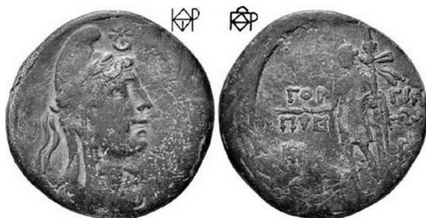
Гл. 5. Зображення горгіпійського мідного обола із сайту “Монети Боспору” (№ 210-3284)

Євпатора в образі Мена. “Ототожнення Мітрідата Євпатора з Меном переконливо доводять монети боспорських міст Пантікапея, Фанагорії та Горгіпії 100–75 рр. до н. е. з портретом Мітрідата в прикрашеній восьмипроменевими зірками гостроконечній фрїгійській шапці Мена або тіарі Мітри, поверх якої пов’язана діадема, що вказує на царський статус. Її кінці з’єднані вузлами і спадають ззаду на плечі вздовж потилиці та шиї царя, а на лобі у нього зірка та півмісяць – герб Понту та династії Мітрідатидів, символ місячно-солярних божеств – Мена, Мітри, Персея, Ісиди і т. д.” [15, с. 310].