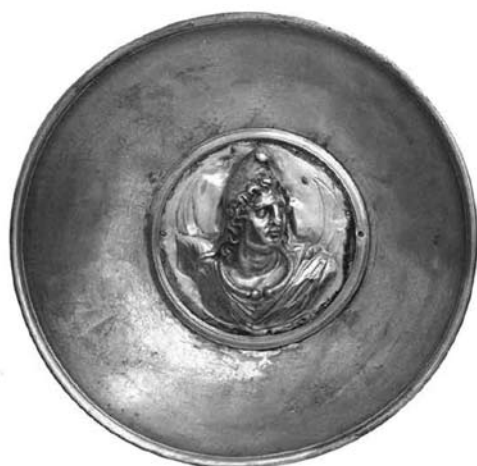
Іл. 2. Срібне блюдо із зображенням Мена з книги М. Й. Вермасерена (1989) (№ 65) 6

На рельєфах він часто зображений сидячи на барані чи півні [21, р. 80]. Лише в Малій Азії барельєфи представляють Мена верхи на коні [21, р. 104].