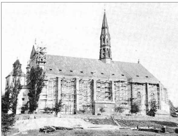
2. Katedra w Sandomierzu w czasie prac w latach 1886–1889, fotografia Marcin Kasiewicz, ok. 1890 roku, [w:] ksiądz Józef Rokoszny, Święte pamiątki Sandomierza , Warszawa, 1902, reprint, s. 14