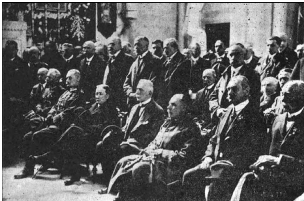
Іл. 5. Львівське мисливське товариство перед вітварем св. Губерта [14, s. 101]

Голова товариства відзначив, що всі з'їзди товариства розпочиналися з прославлення Бога, цієї традиції дотримуватимуться і надалі [13]. Чин посвячення каплиці виконав ксьондз Болеслав Твардовський, наголосивши у проповіді, що “католицька церква має багато святих у різних сферах – святих королів, святих вчених, святих рільників, святих слуг. У цьому великому переліку святих є й ім'я святого Губерта,