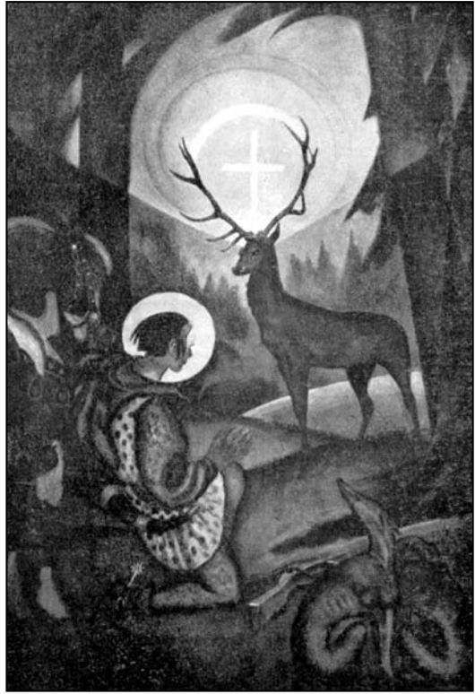
Іл. 4. Образ св. Губерта, подарований Малопольським мисливським товариством, у вітварі костелу Св. Єлизавети у Львові [17]