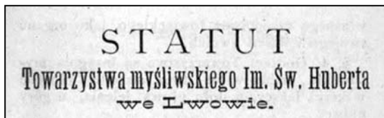
Іл. 1. Статут Львівського мисливського товариства ім. Св. Губерта (1884)

Опікою саме св. Губерта користувалось багато мисливців та мисливських товариств Галичини. Відомо, що в 1876 р. у Львові заснували мисливське товариство ім. Св. Губерта [2], у 1880 р. воно нараховувало 25 членів, а статут товариства був затверджений Галицьким намісництвом 19 грудня 1879 р. [3]. Вже у 1886 р. товариство налічувало