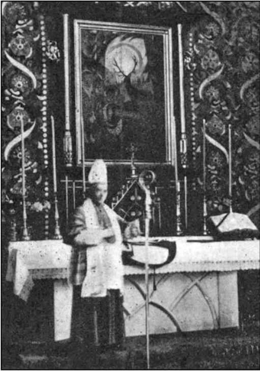
Іл. 6. Єпископ Болеслав Твардовський під час посвячення збудованого вітваря св. Губерта [14]

Але, як з'ясувалось пізніше (1935), мисливська громада Львова мала проблеми з парафіянами костелу, які побажали, щоб вітраж св. Губерта був прикритий іконою Діви Марії, так як у їхньому розумінні святий не може зображатися зі збросю в руках, добуваючи дичину. Це дуже обурило мисливців, які власним коштом побудували каплицю. Особливо їх вразила бездіяльність місцевого священника та його небажання конфліктувати з парафіянами. На думку голови Галицького мисливського товариства, така ситуація склалась через те, що парафіяни походили з нижчих прошарків суспільства і були малоосвіченими. Було подано відповідне звернення від Галицького мисливського товариства архієпископу, який пообіцяв дану ситуацію виправити на їхню користь [16].