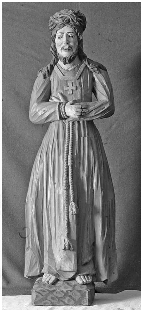
Іл. 4. Скульптура “Хрыстос Назарэй”; дрэва, разьба, паліхромія; 105×37×18 см; з царквы Св. Арханёла Міхаіла в. Сцяпанкі Жабінкаўскага р-на Брэсцкай вобл.; XIX ст. Фота М. П. Мельнікава. МСБК

З іншых цікавых назіранняў адносна такіх статуй варта згадаць, што ў базыльянскай царкве Успення Багародзіцы лешчынскага кляштара на 1823 г. у галоўным алтары ў нішы за заслонай была такая статуя “славутая ласкамі”. У вышыню яна мела два локці з чвэрцю [10, с. 2–5]. На жаль, няма больш ранніх звестак пра гэты храм, якія б дазволілі прасачыць традыцыі шанавання названай скульптуры. Магчыма, наяўнасць у базыльянскай царкве цудадзейнай статуі паўплывала на распаўсюджанне скульптур “Хрыста Назарэя” сярод беларускіх грэка-каталіцкіх цэркваў. Увогуле, такія разьбяныя фігуры ў сярэдзіне XVIII – пачатку XIX ст. зафіксаваны ў храмах розных рэгіёнаў. Выключэннем з’яўляецца толькі Турава-Пінская епархія і Палескі афіцыялат Кіеўскай архіепархіі, дзе скульптур увогуле не было, не толькі такой іканаграфіі. А ў іншых афіцыялатах Кіеўскай архіепархіі, у