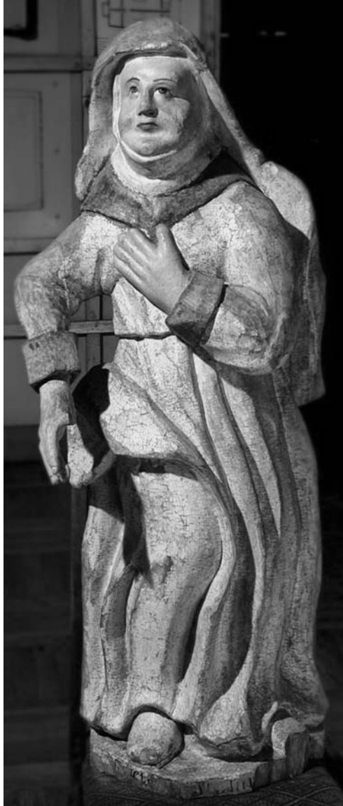
Іл. 10. Скульптура “Св. Ганна”; дрэва, разьба, паліхромія; 105×45×23 см; з царквы Св. Мікалая в. Вярховічы Камянецкага р-на Брэсцкай вобл.; сярэдзіна XVIII ст. Фота М. П. Мельнікава. МСБК

абрази [4, арк. 32 адв.]. Пра тое, што гэта тья фігуры, якія паступілі ў МСБК з в. Вярховічы, сцвярджаць нельга, бо паміж храмамі адлегласць 170 км, а гэта даволі шмат. Разам з тым, і згадка ў візіце пра статуі “Ганны і Іакіма”, і захаванья помнікі з такімі выявамі даюць уяўленне пра сюжэтную разнастайнасць алтарных грэка-каталіцкіх скульптур.