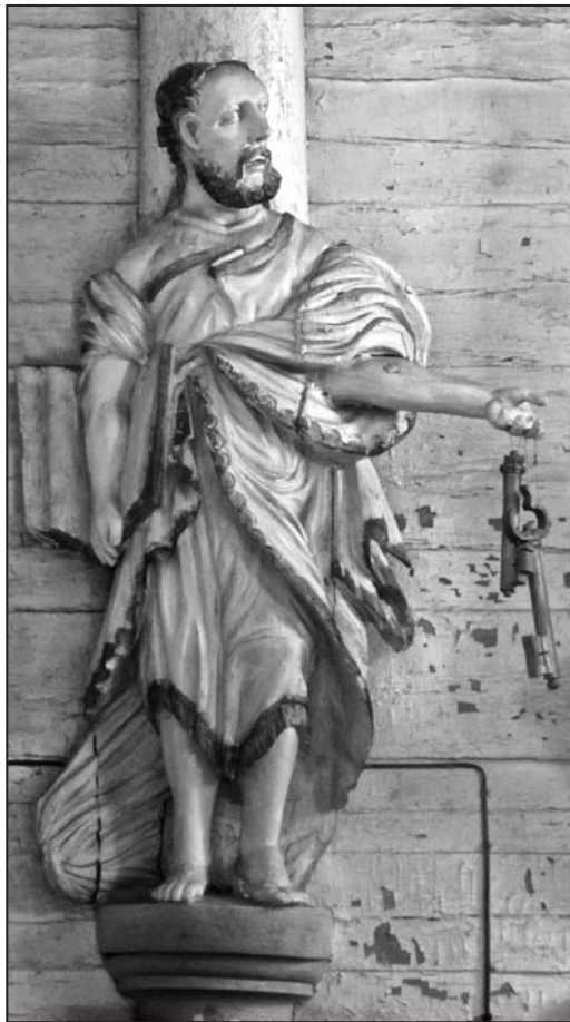
Іл. 6. Скульптура “Св. Апостал Пётр” у галоўным алтары; дрэва, разьба; царква Св. Мікалая а.г. Кажан-Гарадок Лунінецкага р-на Брэсцкай вобл.; пачатак XIX ст.

Колішнім уніяцкім галоўным алтаром, дзе захаваліся скульптуры, з’яўляецца помнік у царкве Св. Мікалая а.г. Кажан-Гарадок Лунінецкага р-на Брэсцкай вобласці, які знаходзіцца ў віме за іканастасам. Тут цэнтральнае месца адведзена абразу, але ў фарміраванні мастацкага вобраза ўсяго ансамбля ўдзельнічаюць скульптуры. Унізе паабাপал калонаў, паміж якімі размешчаны жывапісны твор, знаходзяцца скульптуры Свв. Апосталаў Пятра і Паўла (іл. 6, 7). А ў верхняй частцы алтара размешчана аб’ёмная кампазіцыя з некалькіх раз’бяных фігур (іл. 8), цэнтральная з якіх – Ян Хрысціцель (іл. 9). Побач з ім – фігуркі анёлаў. Парныя скульптуры анёлаў таксама выкарыстаны і для аздобы бакавых алтароў, дзе яны размешчаны ў верхняй частцы канструкцыі.