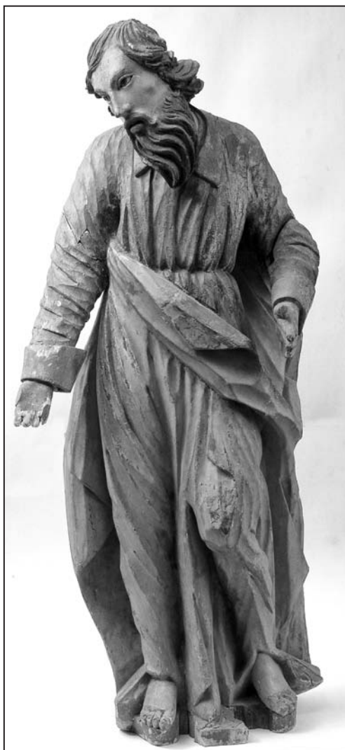
Іл. 5. Скульптура “Св. Апостал Павел”; дрэва, разьба, паліхромія; 116×47×32 см; з царквы Свв. Апосталаў Пятра і Паўла в. Гарадзішча Камянецкага р-на Брэсцкай вобл.; сярэдзіна XVIII ст.

Пэўнае распаўсюджанне ў грэка-каталіцкіх храмах атрымалі і статуі Апосталаў Пятра і Паўла. Такія скульптуры размяшчаліся ў некаторых іканастасах, пра што размова вялася ў адпаведным раздзеле, а таксама вядомы і выпадкі, калі яны знаходзіліся ў алтарах. Да нашага часу захавалася менавіта алтарная статуя Св. Паўла і Св. Пятра з в. Гарадзішча Камянецкага р-ну Брэсцкай вобл. (іл. 5). З візітаў за 1759 і 1802 гг. гэтай царквы вынікае, што ў галоўным алтары, акрамя ікон, размяшчаліся яшчэ і фігуры Свв. Апосталаў Пятра і Паўла [22, с. 292; 23, арк. 32]. Але на 1725 г. іх яшчэ не было [9, арк. 152 адв.], ды і ўвогуле алтары тады адрозніваліся ад тых, якія былі ў храме ў другой палове XVIII – пачатку XIX ст. Гэта дазваляе выказаць думку, што скульптуры былі зроблены паміж 1725 і 1759 гг., што дае магчымасць больш дакладна вызначыць іх час стварэння. Паводле му-