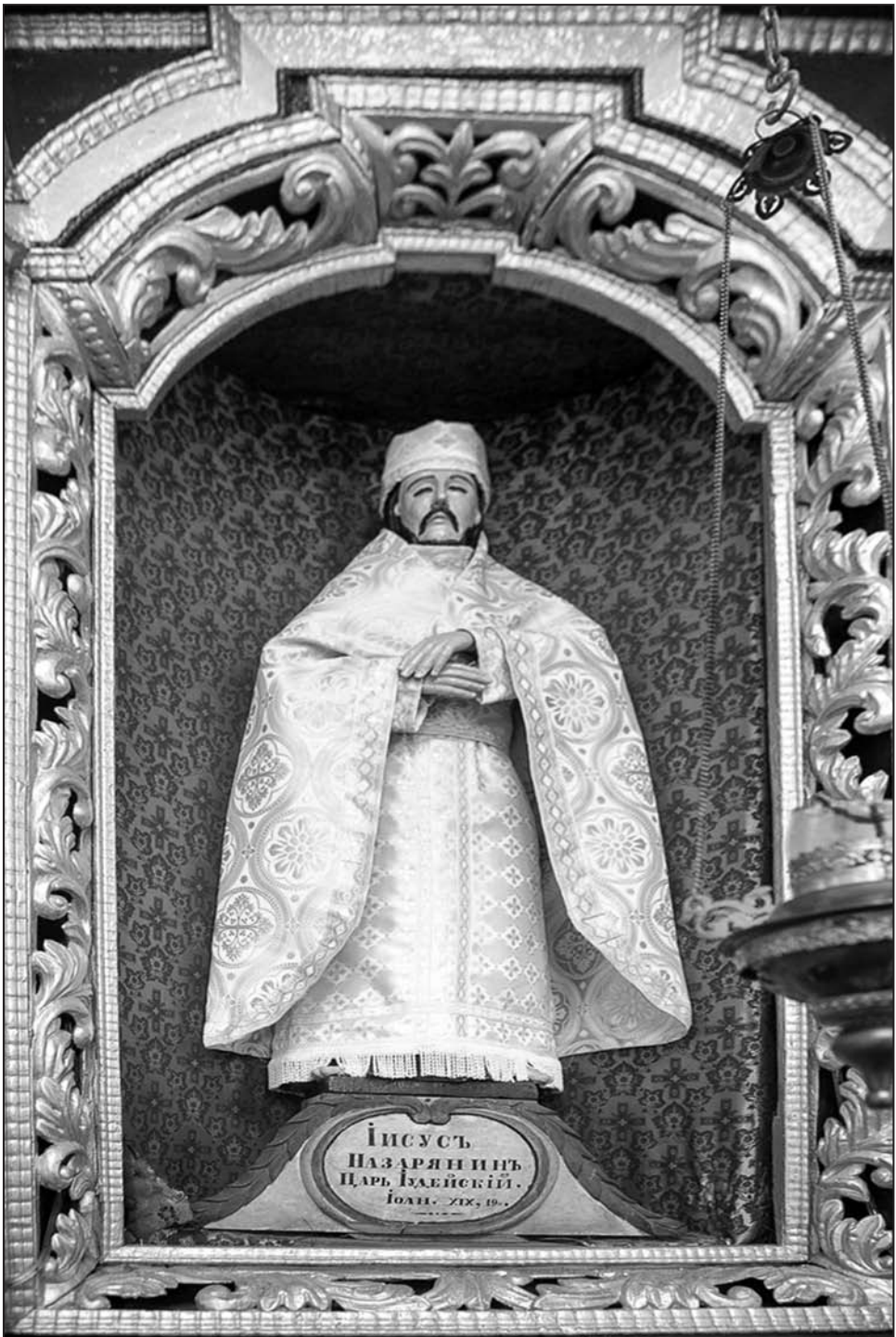
Іл. 1. Скульптура “Хрыстос Назарэй” у адным з уніяцкіх алтароў у царкве Пераўтварэння в. Порплішча Докшыцкага р-на Віцебскай вобл. Фота аўтара, 2018 г.