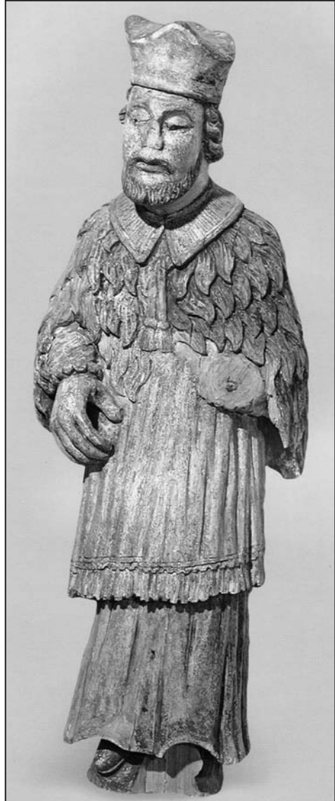
Іл. 12. Скульптура “Ян Непамук”; дрэва, разьба, паліхромія; 66×24×15 см; з царквы Св. Аляксандра Неўскага в. Стрэльна Іванаўскага р-на Брэсцкай вобл.; XVIII ст. Фота М. П. Мельнікава. МСБК

Такім чынам, з візітацыйных актаў вынікае, што найчасцей ў выглядзе статуі была вырашана постаць Ісуса Хрыста ў некалькіх сюжэтах ці варыянтах іканаграфіі. Так, пераважная большасць прыкладаў сведчыць пра тое, што ў аб'ёмна-прасторавай кампазіцыі было шырока прадстаўлена “Укрыжаванне” або “Укрыжаванне з Перадстаячымі”. Значнае распаўсюджанне атрымалі скульптуры “Хрыстос Назарэй”, чаму садзейнічала наяўнасць такой цудадейнай статуі ў касцёле Свв. Апосталаў Петра і Паўла на Антокалі ў Вільні, а таксама такія скульптуры былі мясцова шануемымі і ва ўніяцкіх храмах. Сярод іншых персанажаў, у фігуратыўных творах былі прадстаўлены Свв. Апосталы Пётр і Павел, Ганна і Іакім, Ян Непамук, Дзева Марыя. Паказальна, што ў Тураўскім афіцыялаце Турава-Пінскай епархіі, які зазнаў найменшы ўплыў лацінізацыі, скульптурныя выявы не сустракаліся ўвогуле.