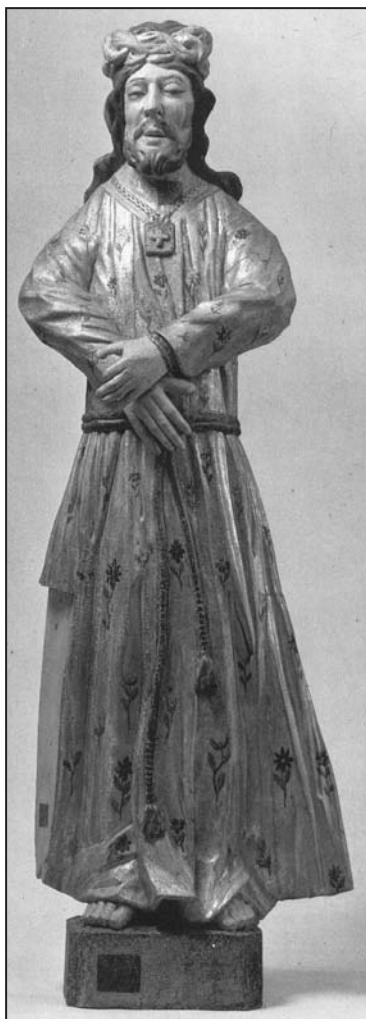
Іл. 2. Скульптура “Хрыстос Назарэй”; дрэва, разьба, тэмпера, пазалота; 137×43×22 см; з Мікалаеўскай царквы а.г. Азяты Жабінкаўскага р-на Брэсцкай вобл.; трэцяя чвэрць XVIII ст. НММ РБ

Аналагічная скульптура з царквы Св. Мікалая в. Азяты (Жабінкаўскі р-н Брэсцкай вобласці) дайшла да нашага часу і захоўваецца ў НММ РБ [3, іл. 144] (іл. 2). Пра яе колішнія размяшчэнне ў храме можна атрымаць звесткі з візітацыйных актаў. Так, у дакументах за 1802 г. пры апісанні галоўнага алтара згадваецца скульптура на сюжэт “Хрыстос Назарэй”, якая, дарэчы, хавалася за жывапіснай засовай з выявай “Каранаванне Божай Маці”. Відавочна, ў архіўнай крыніцы згадваецца менавіта тая статуя, якая і дайшла да нашага часу. Пры апублікаванні скульптуры ў альбоме “Пластыка Беларусі XII–XVIII ст.” яна фігуруе пад назвай “Гэта чалавек” і з датай – трэцяя чвэрць XVIII ст. [3, іл. 144]. Што датычыцца наймення, то тут ніякіх прычэпаў няма, бо гэта адзін з варыянтаў для абазначэння дадзенай іканаграфіі. А вось дата з’яўляецца крыху спрэчнай. Так,