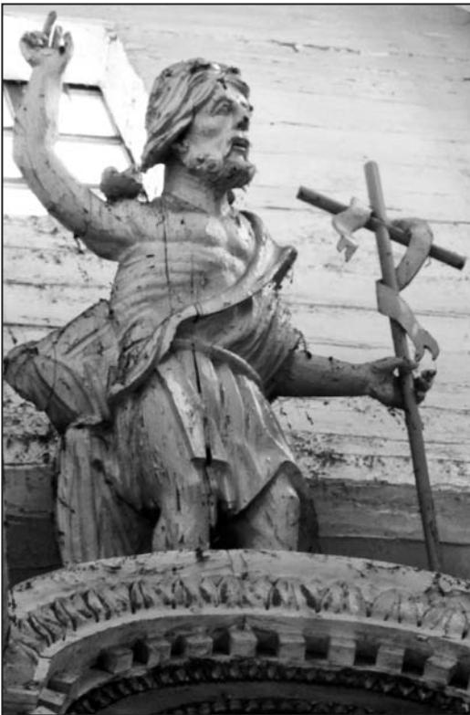
Іл. 9. Скульптура “Ян Правазвеснік” у наверхішы галоўнага алтара; дрэва, разьба; царква Св. Мікалая а.г. Кажан-Гарадок Лунінецкага р-на Брэсцкай вобл.; пачатак XIX ст.

З захаваных помнікаў звяртаюць на сябе ўвагу парныя творы “Св. Ганна” і “Св. Іакім”, якія паступілі ў МСБК з царквы в. Вярховічы Камянецкага р-на Брэсцкай вобласці [6, с. 164, 165] (іл. 10, 11). Творы датуюцца сярэдзінай XVIII ст. У апісаннях гэтага храма за 1759 і 1802 гг. скульптуры ўвогуле не згадваюцца. Пры тым што візіта 1759 г. вылучаецца падрабязнасцю. Хутчэй за ўсё, гэтыя статуі паступілі ў царкву з нейкай іншай. Праўда, ў якой з суседніх царкваў знаходзіліся такія фігуры – высветліць не ўдалося. Адзінае вядомае нам упамінанне ў візітах пра статуі “Ганны і Іакіма” датычыцца царквы Св. Мікалая в. Здзітава Кобрынскага р-на Брэскай вобласці. Там на 1784 г. такія скульптуры знаходзіліся ў галоўным алтарах, дзе, дарэчы, акрамя іх, былі і