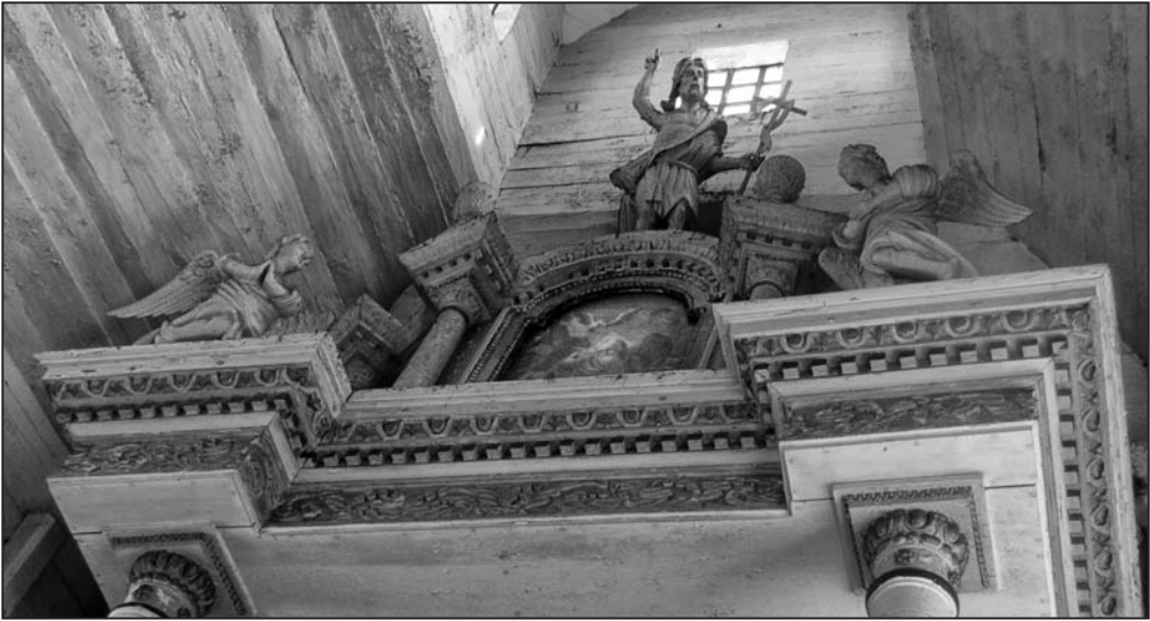
Іл. 8. Скульптурная кампазіцыя ў наверхішы галоўнага алтара; дрэва, разьба; царква Св. Мікалая а.г. Кажан-Гарадок Лунінецкага р-на Брэсцкай вобл.; пачатак XIX ст. Фота І. М. Ажашкоўскай, 2015 г.