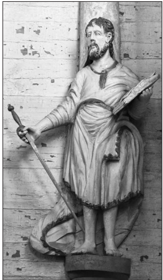
Іл. 7. Скульптура “Св. Апостал Павел” у галоўным алтары; дрэва, разьба; царква Св. Мікалая а.г. Кажан-Гарадок Лунінецкага р-на Брэсцкай вобл.; пачатак XIX ст. Фота І. М. Ажашкоўскай, 2015 г.