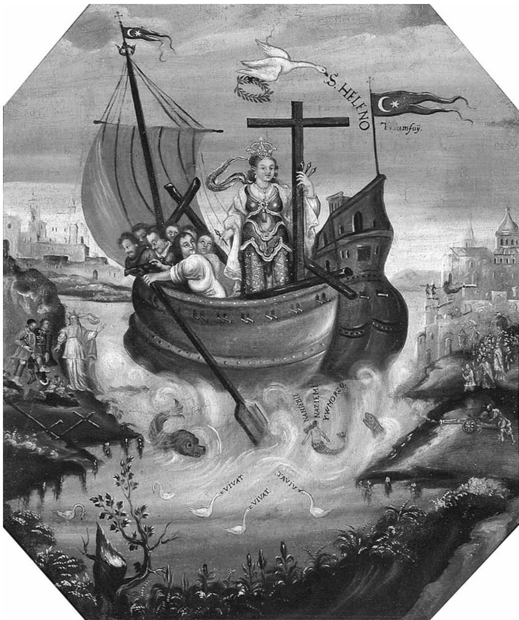
Іл. 4. Трьумф св. Алены. Лідскі раён Гродзенскай вобл., першая палова XVIII ст., палатно, алей, 85×73, Ж-362, КП-3715

бля рэюць турэцкія сцягі. Верагодна, мастак намалюваў іх па той прычыне, што на той час Візантыя была захоплена Асманскай імперыяй.