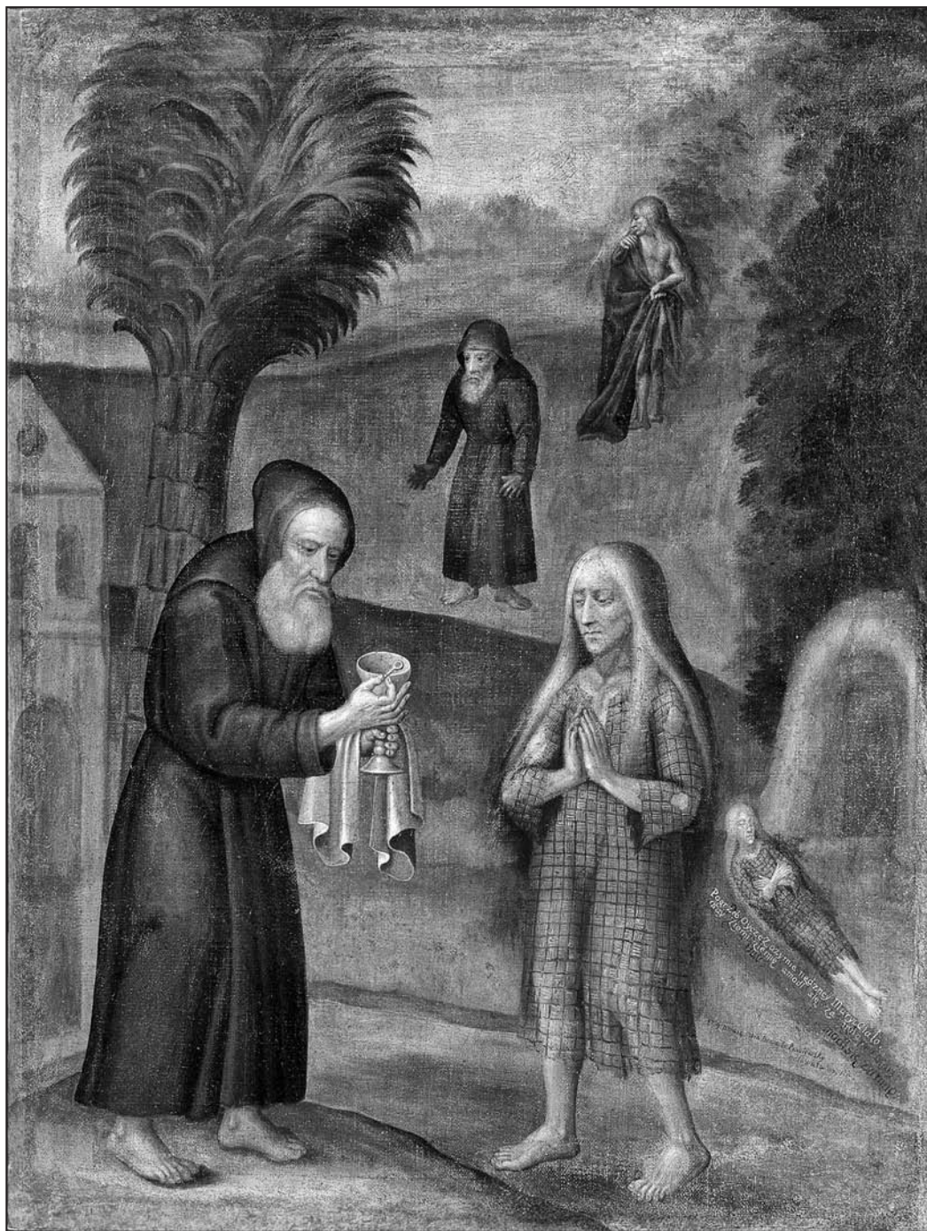
Гл. 1. Прападобная Марыя Егіпецкая. Брэсцкі раён, 1779 г., палатно, алей, 77×60, Ж-112, КП-205