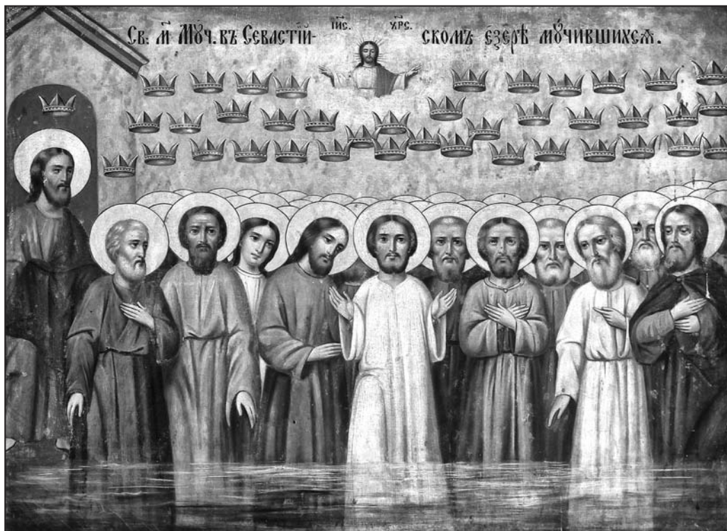
Іл. 2. Севасційскія пакутнікі. Вілейскі раён Мінскай вобл., канец XIXст., палатно, алей, 64×80

скульптуру Маці Божай. Згодна падання, гэтыя рэліквіі Яцак уратаваў, калі ўцякаў з Кіева падчас татарскага нашэсця. Прычым, вялікая і масіўная скульптура Дзевы Марыі цудадейным чынам стала зусім легкой і набыла сваю ранейшую вагу толькі пасля вяртання святога ў Кракаў.