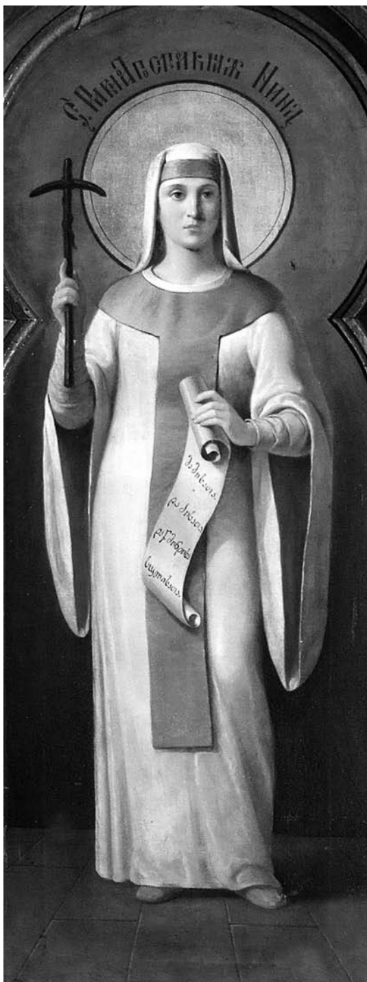
Іл. 5. Святая роўнаапостальная Ніна. Г. Камянец Брэсцкай вобл, пачатак XX ст., палатно, алей, 145×54

Хрысціянскі святы Спірыдон Трыміфунцкі (каля 270–348) шануецца ў ліку свяціцеляў як цудатворац. Ён нарадзіўся на востраве Кіпр, з дзіцячых гадоў пасвіў авечак і ў сваім жыцці стараўся браць прыклад са старазапаветных праведнікаў. У гады праўлення Канстанціна Вялікага (324–337) і яго сына Канстанцыя (337–361) св. Спірыдон быў абраны