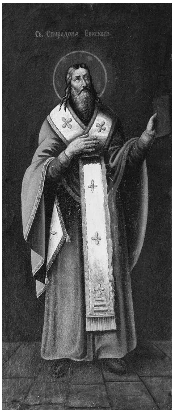
Іл. 6. Святы Спірыдон Трыміфунці. Ваўкавыскі раён Гродзенскай вобл., палатно, алей, 150×73

першым епіскапам кіпрскага горада Трыміфунта, дзе, па царкоўным паданні, здзейсніў многа цудаў. На Першым Усяленскім Саборы ў 325 г., дзякуючы доказам Спірыдона было асуджана арыянства. Памёр свяціцель Спірыдон у 348 г., падчас малітвы. Дзень яго памяці – 25 (12) снежня ў праваслаўнай царкве і 14 снежня – ў каталіцкай.