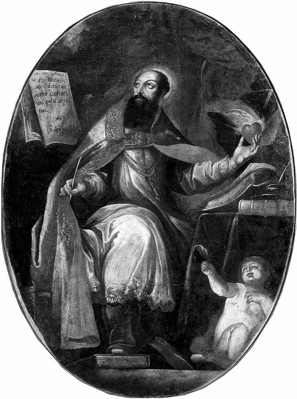
Іл. 8. Святы Аґустын. Гродзенская вобл., XVIII ст., палатно, алей, 126×95, Ж-80, КП-845