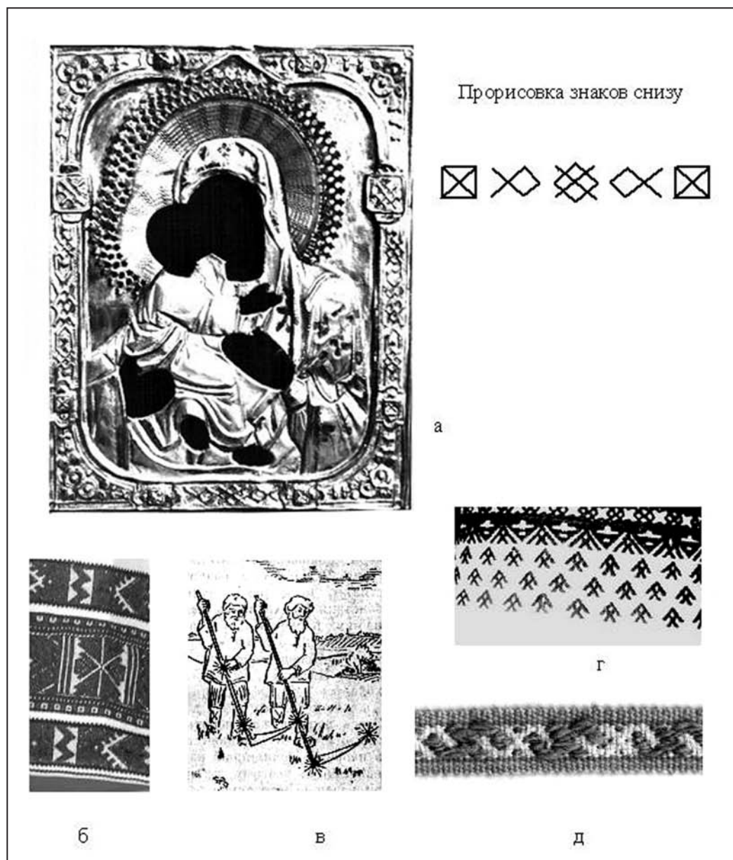
Ил. 3-а – руноподобные знаки внизу оклада Матери Божьей, начало XX века, частная коллекция А. А. Ярошевича; б – фрагмент белорусской юбки, Малоритский район, Брестская обл, начало XX в., коллекция Музея древнебелорусской культуры НАНБ; в – изображение созвездия Кассиопеи у белорусов называется Косари [20, с.139]; г – фрагмент воронежской женской рубашки с рунами орхонского типа; д – фрагмент белорусского пояса с рунами орхонского типа, сер. XX в., Музей древнебелорусской культуры НАНБ

(Одал) изображены внизу (ил. 3-а). Этот знак обнаружен нами также и на белорусском рушнике [12, с. 159].